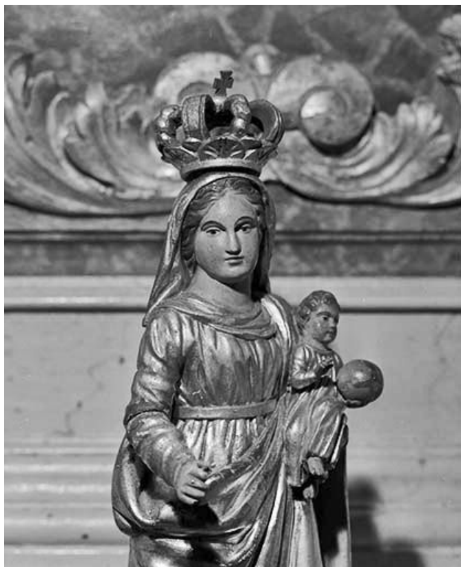
Vue à mi corps de trois quart droit.