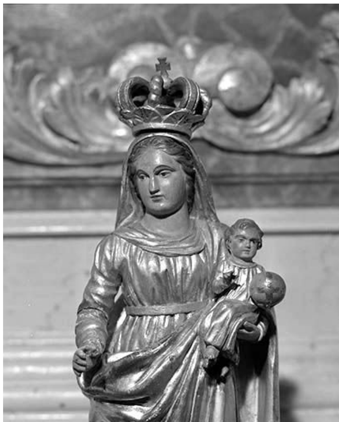
Vue à mi-corps de face.