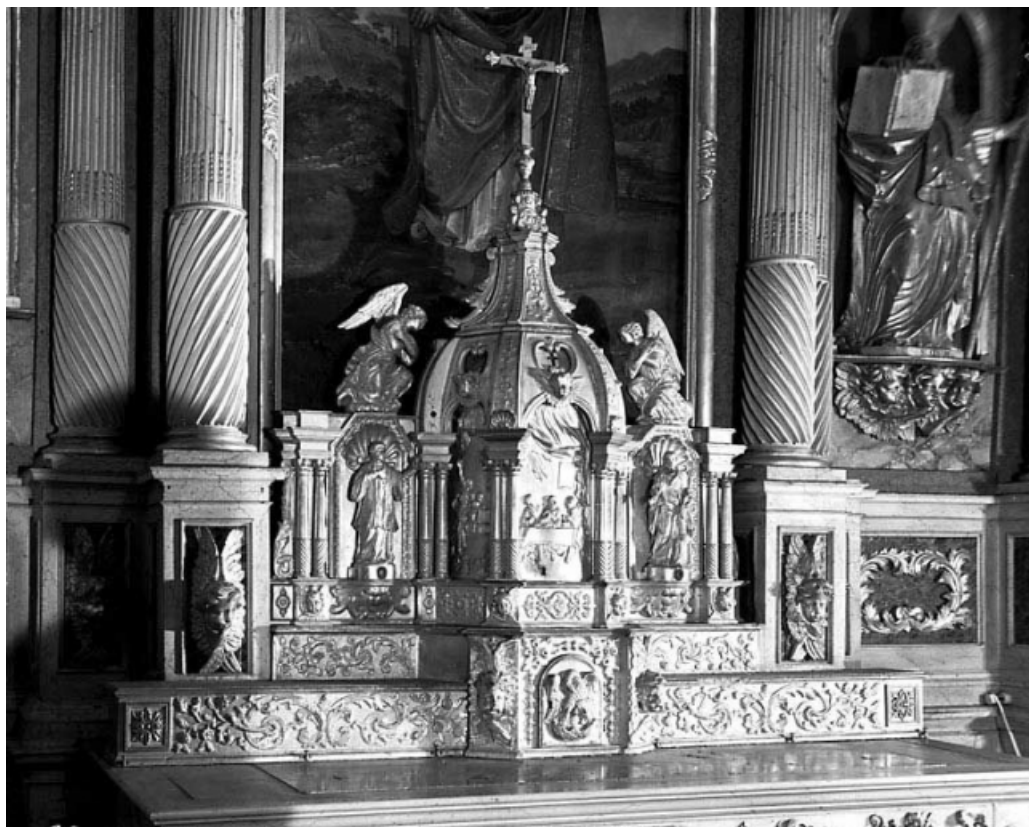
Vue de trois quart gauche.