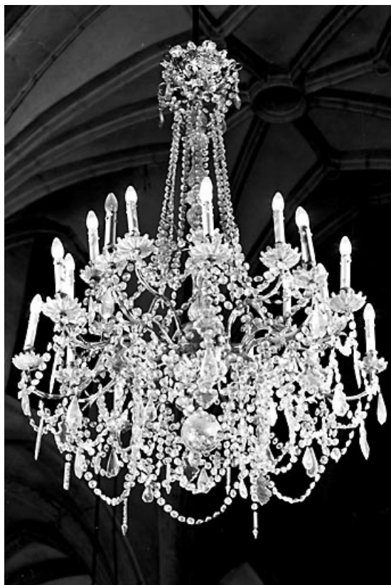
Vue d'ensemble d'un lustre. 25, Ornans rue Saint-Laurent