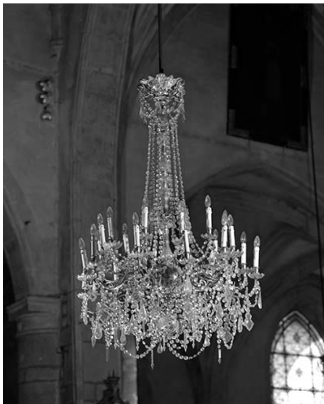
Vue d'ensemble d'un lustre.