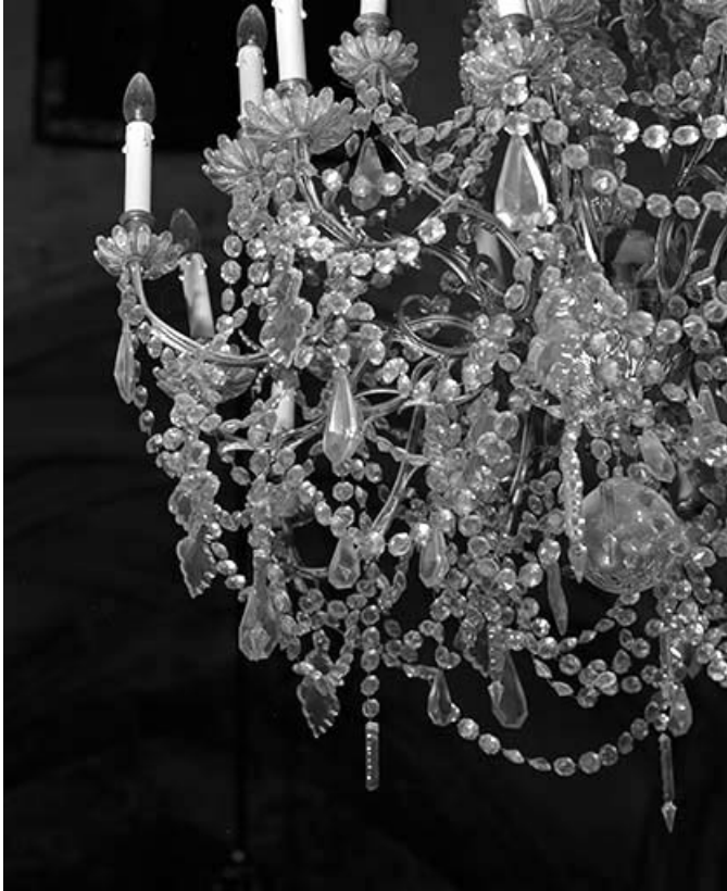
Détail d'un lustre.