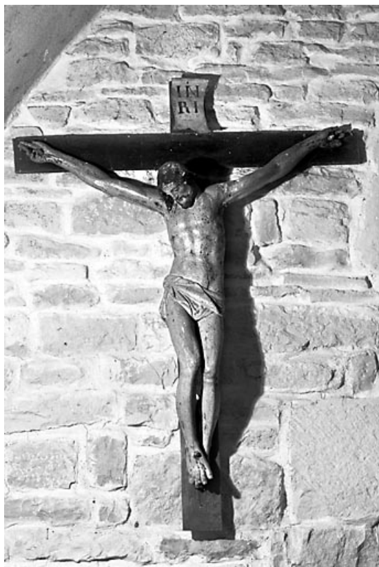
Vue de face. 25, Échevannes