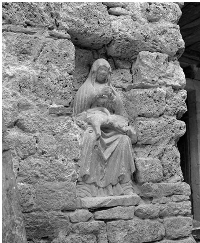
Vue de trois quart droit. 25, Mouthier-Haute-Pierre