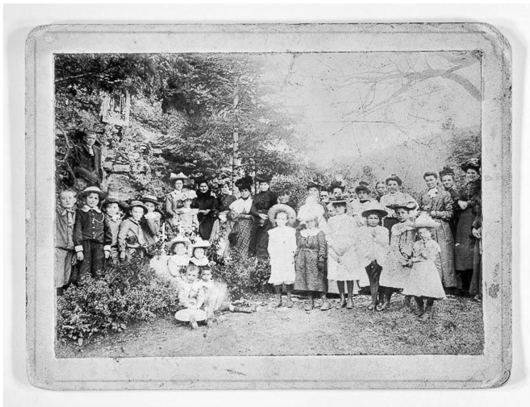
Notre-Dame du Rebrais le jour de l'Ascension, vers 1900.