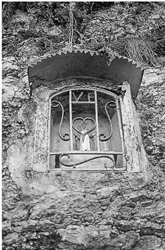
Statue (statuette) de Notre-Dame du Rebrais.