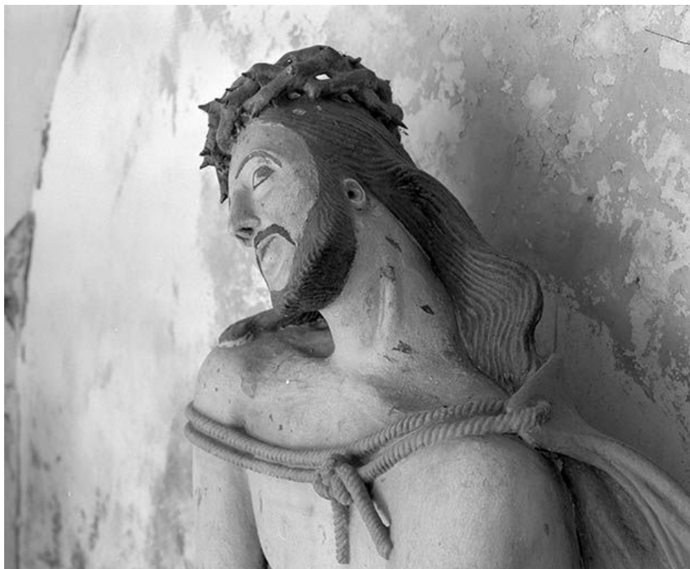
Détail : tête du Christ.