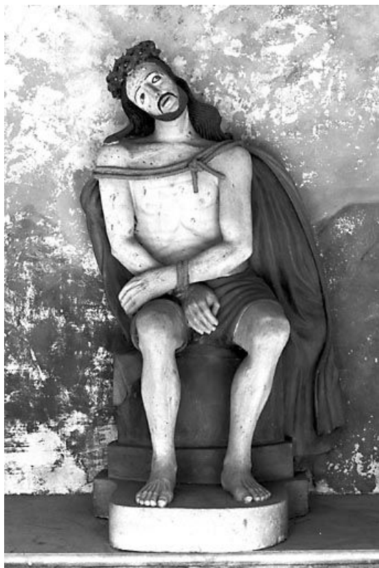
Vue de face. 25, Longeville