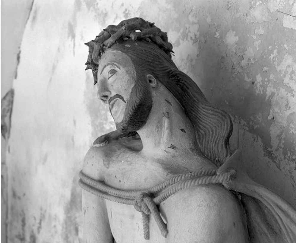
Détail : tête du Christ.