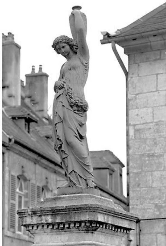
Vue d'ensemble de trois quarts.