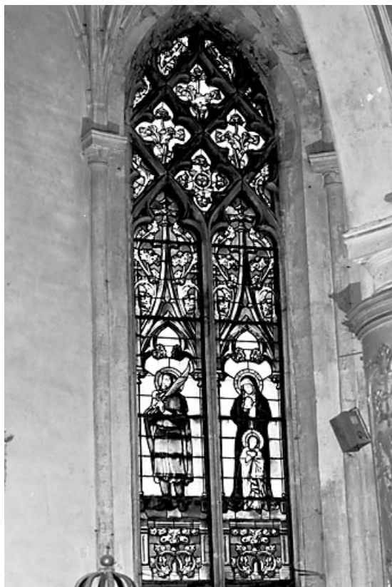
Baie n° 1 : saint Vernier et Education de la Vierge. 25, Ornans rue Saint-Laurent