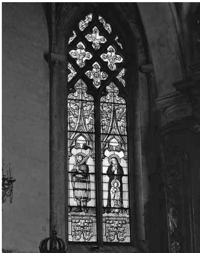
Baie 1 : saint Vernier, Education de la Vierge.