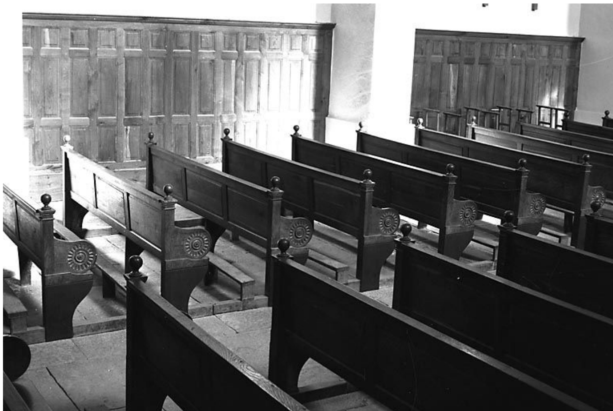
Vue d'ensemble. 25, Trépot