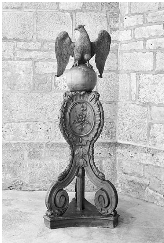
Vue d'ensemble du lutrin n° 2. 25, Bannans