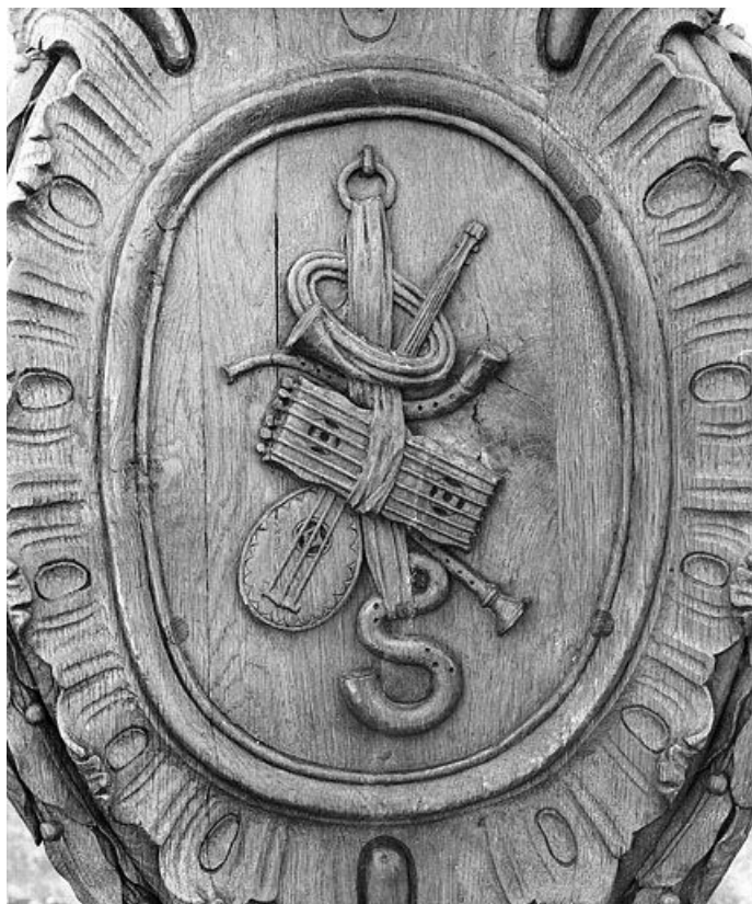
Lutrin n° 1 : médaillon avec cor de chasse et autres instruments. 25, Bannans