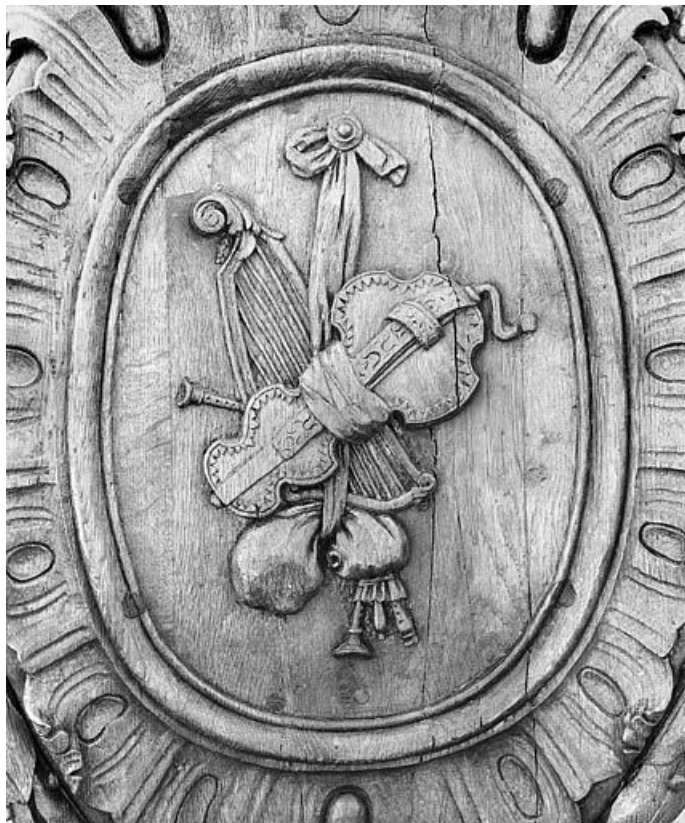
Lutrin n° 1 : médaillon avec harpe et autres instruments. 25, Bannans