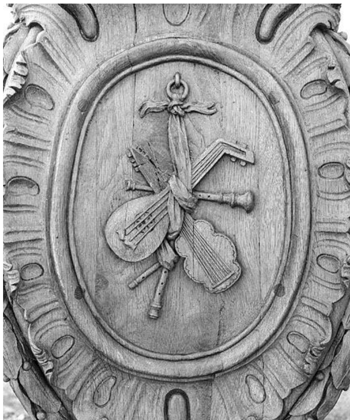
Lutrin n° 2 : médaillon avec luth et autres instruments. 25, Bannans