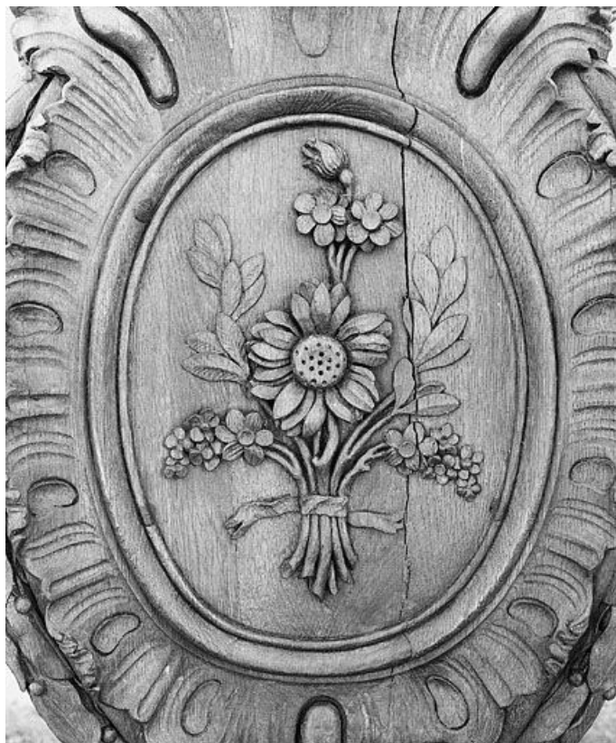
Lutrin n° 2 : médaillon avec bouquet de fleurs. 25, Bannans