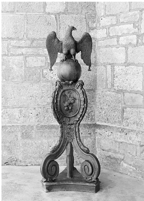
Vue d'ensemble du lutrin n° 1. 25, Bannans