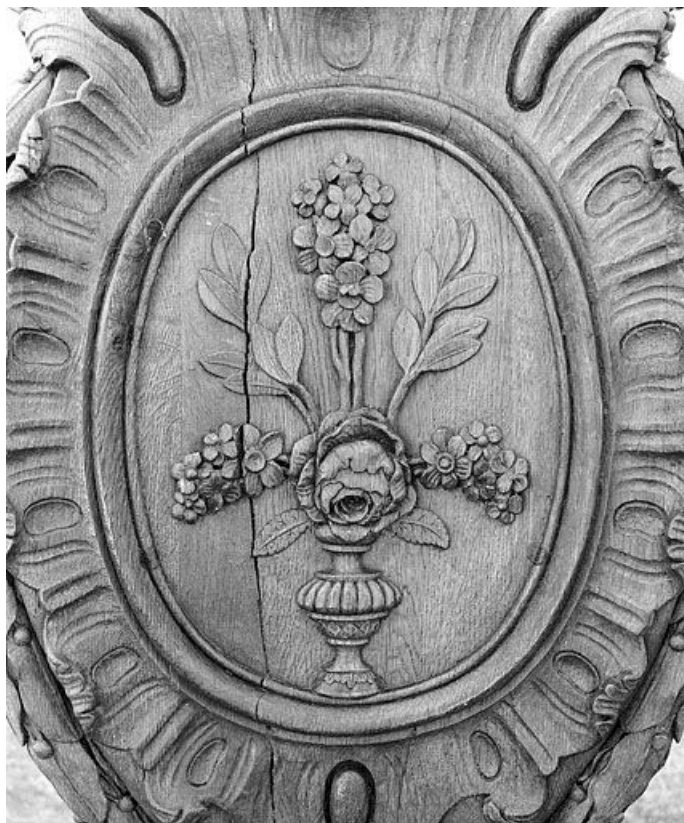
Lutrin n° 1 : médaillon avec bouquet de fleurs. 25, Bannans