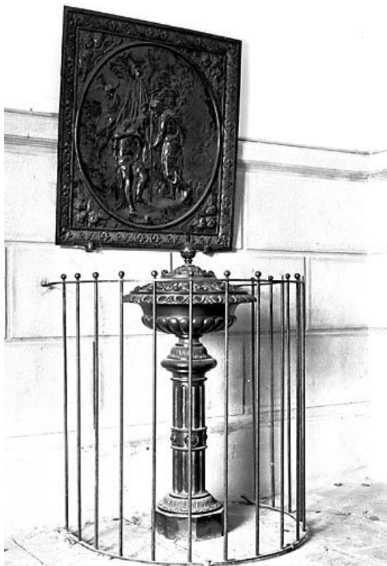
Vue d'ensemble des fontes baptismaux. 25, Villers-sous-Montrond