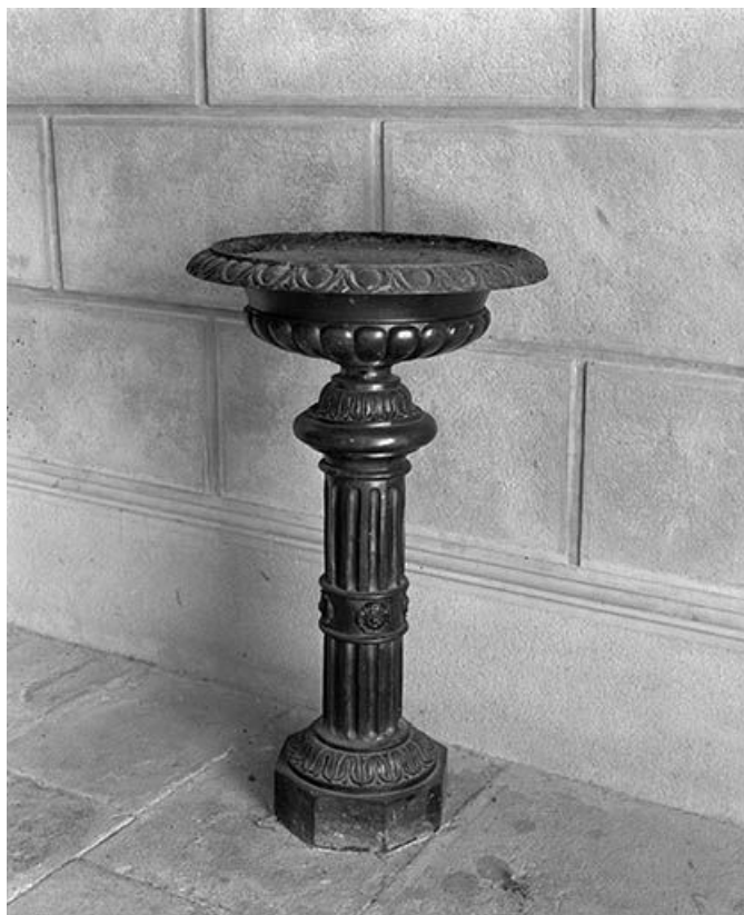
Vue d'ensemble du bénitier.