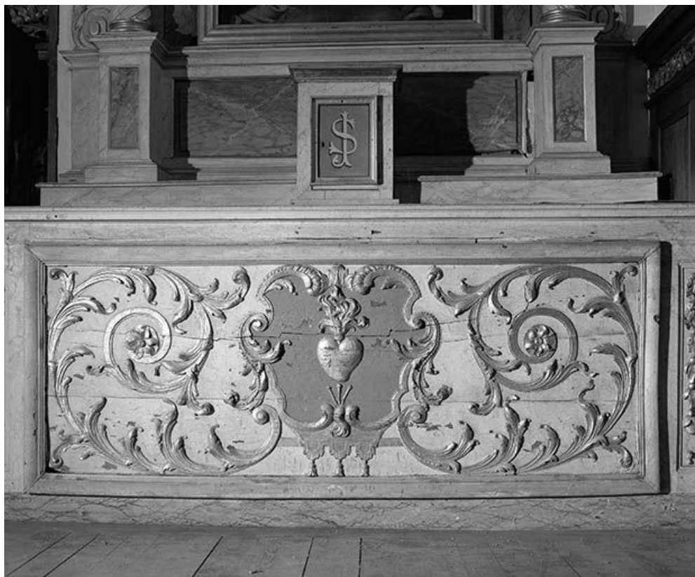
Vue de l'autel du Sacré-Coeur.