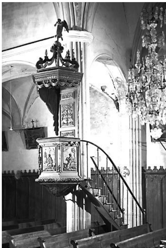
Vue d'ensemble. 25, Guyans-Durnes