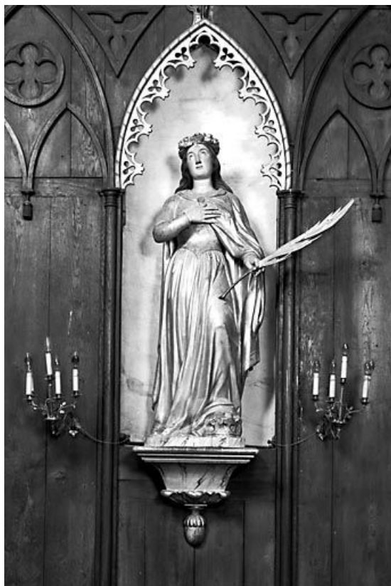
Sainte Philomène. 25, Guyans-Durnes