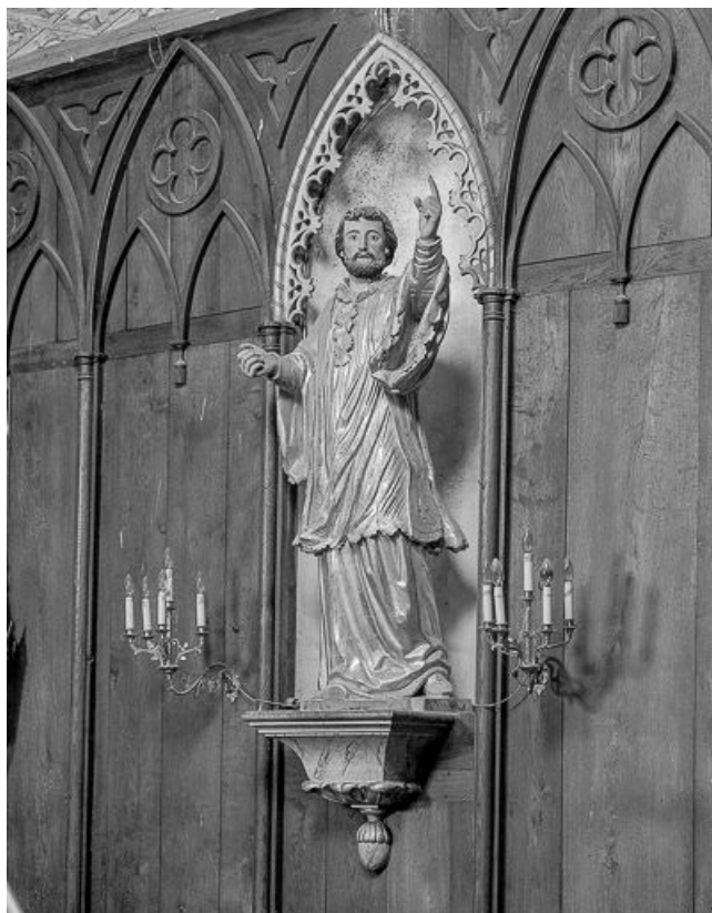
Saint François-Xavier. 25, Guyans-Durnes