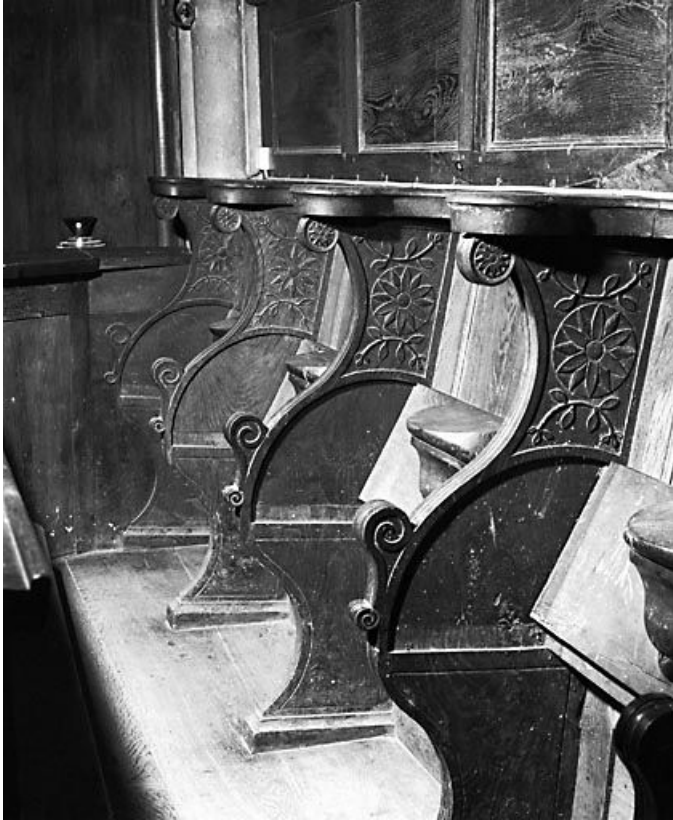
Vue des stalles du côté droit du chœur.