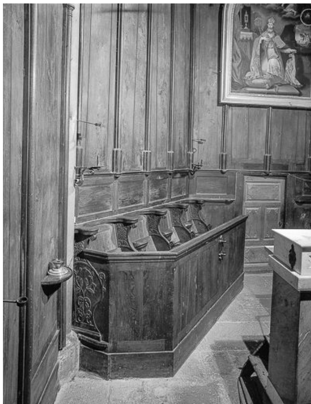
Vue d'ensemble du côté gauche du chœur. 25, Guyans-Durnes