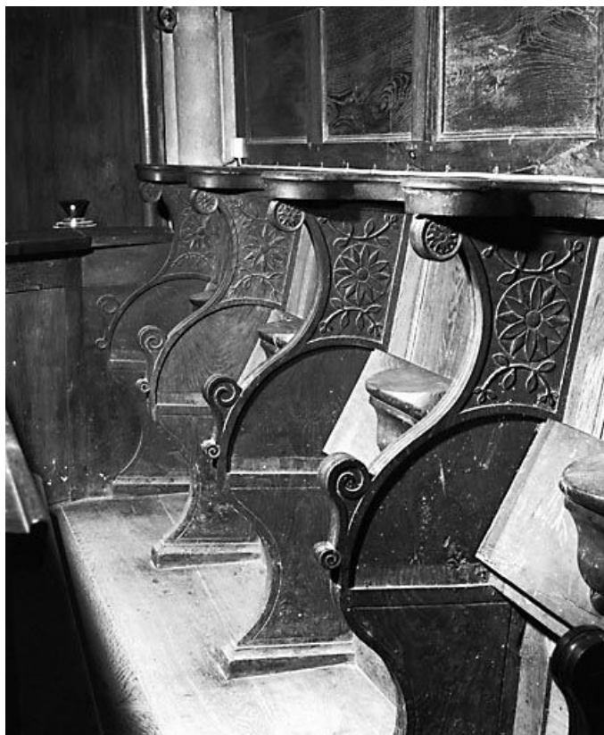
Vue des stalles du côté droit du choeur. 25, Guyans-Durnes