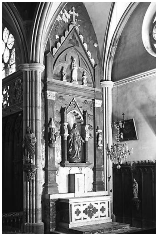
Vue d'ensemble de l'autel secondaire sud. 25, Guyans-Durnes