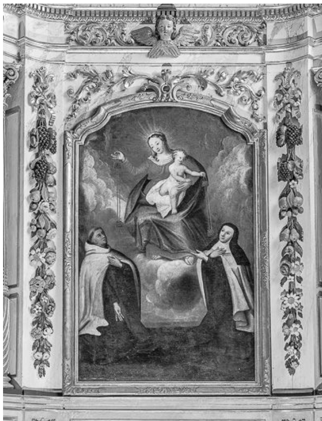
Vue générale. 25, Bannans