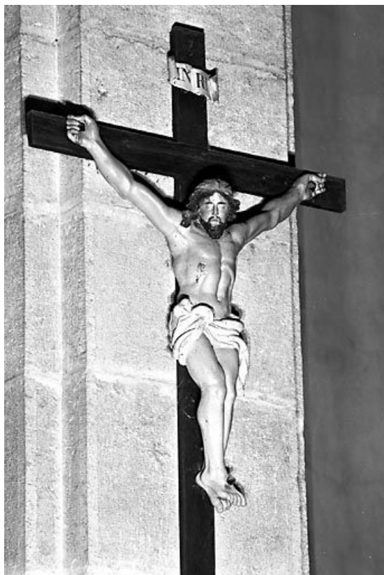
Vue d'ensemble. 25, Foucherans