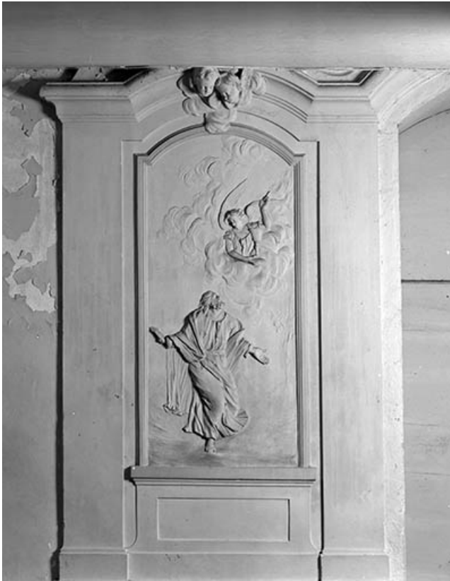
Jésus au Jardin des Oliviers.

25, Durnes, lieudit : Saint-Hippolyte-les-Durnes