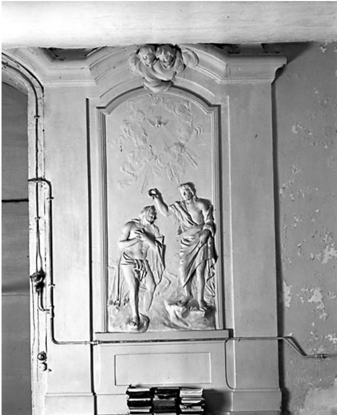
Le Baptême du Christ.

25, Durnes, lieudit : Saint-Hippolyte-les-Durnes