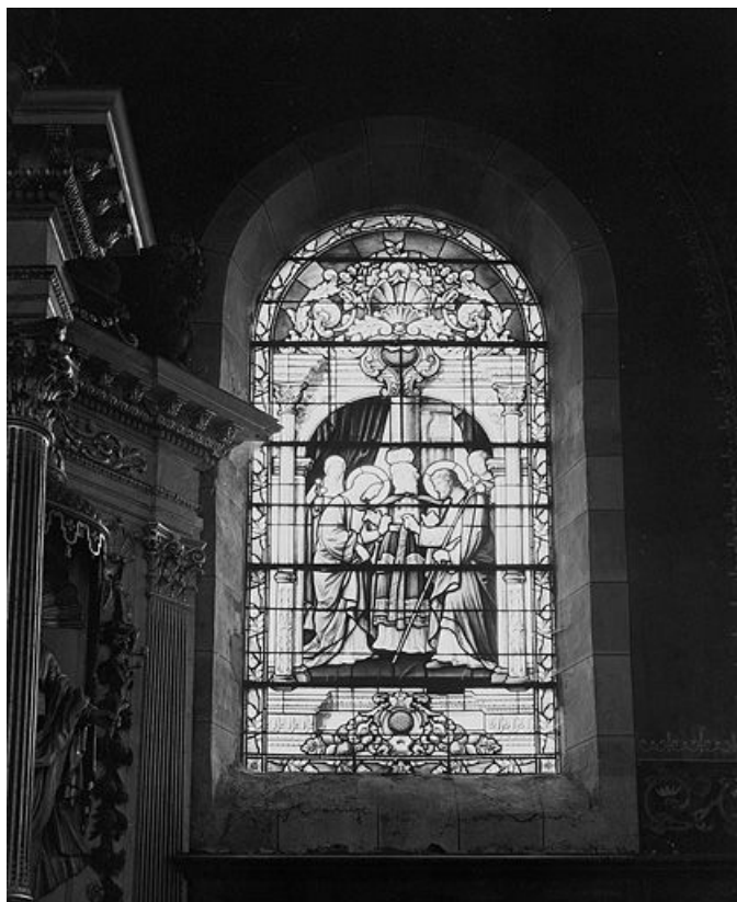
Mariage de la Vierge, baie n° 2.