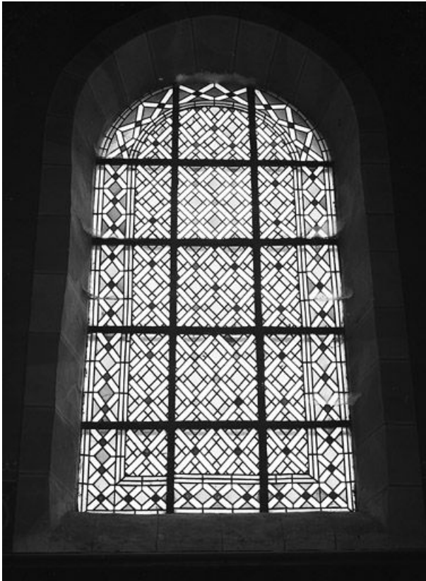
Verrière décorative, baie n° 3.