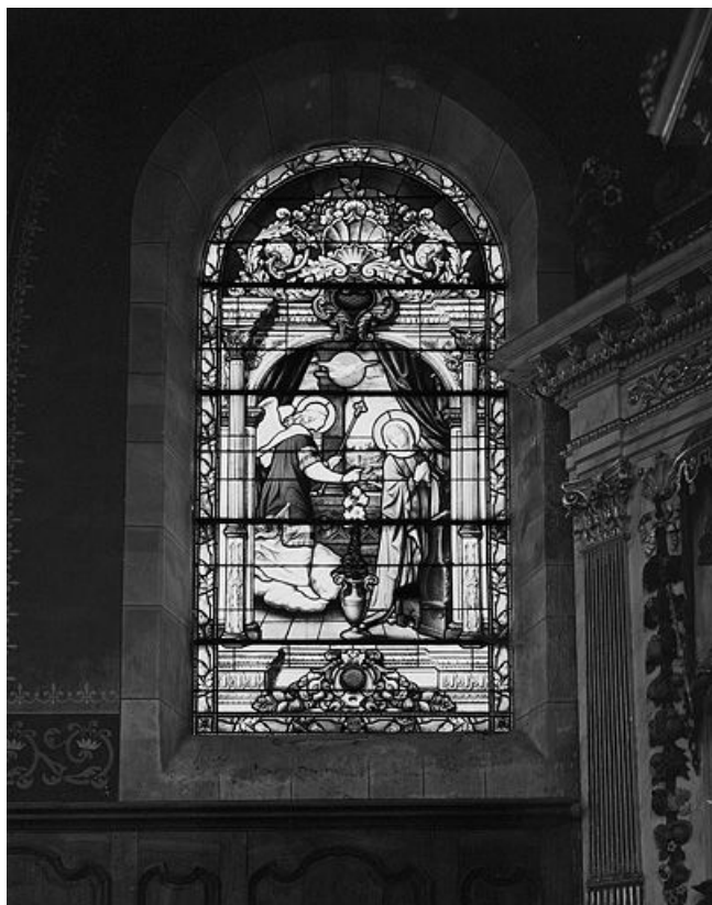
Annonciation, baie n° 1. 25, Bannans