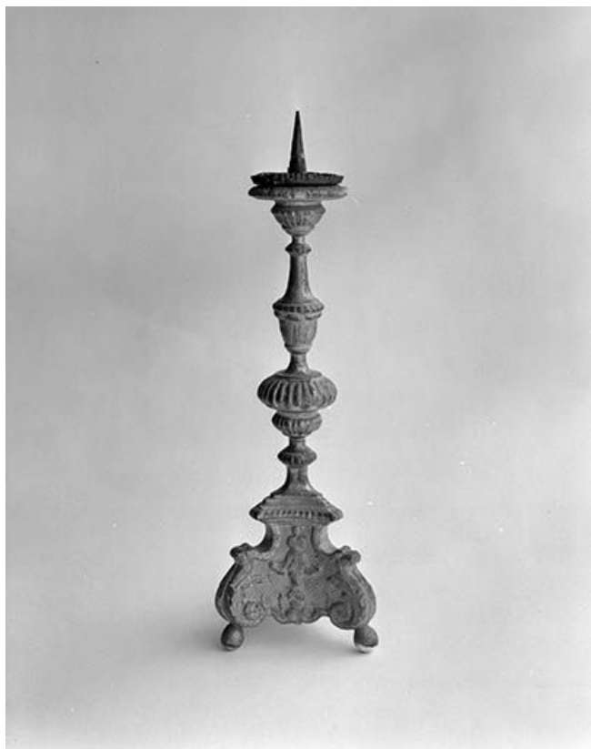
Vue d'un chandelier d'autel.