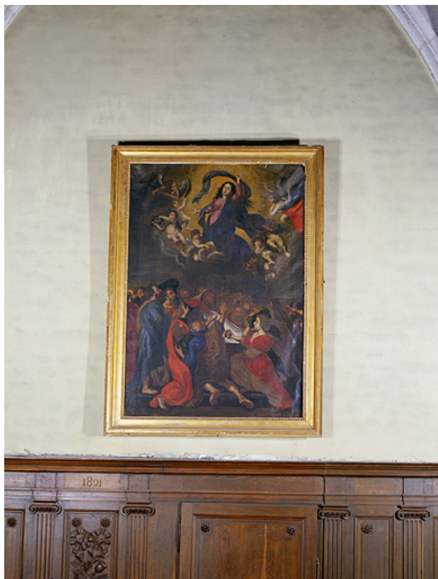
Vue générale. 25, Chantrains