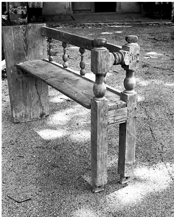
Vue d'un bac.

25, Villers-sous-Chalamont, lieudit : la Mère Eglise