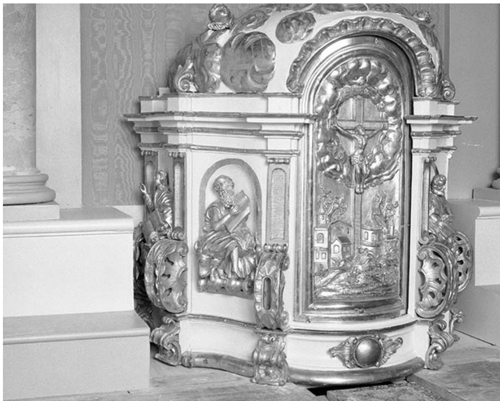
Maître-autel : tabernacle côté gauche. 25, Villeneuve-d'Amont rue du Château