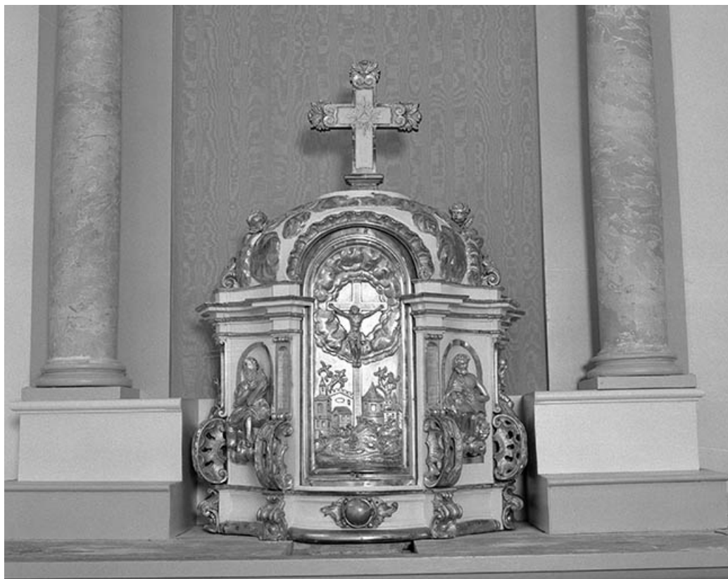
Maître-autel : tabernacle fermé.