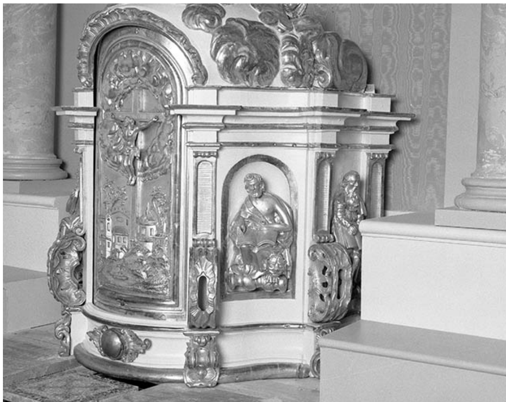
Maître-autel : tabernacle côté droit.