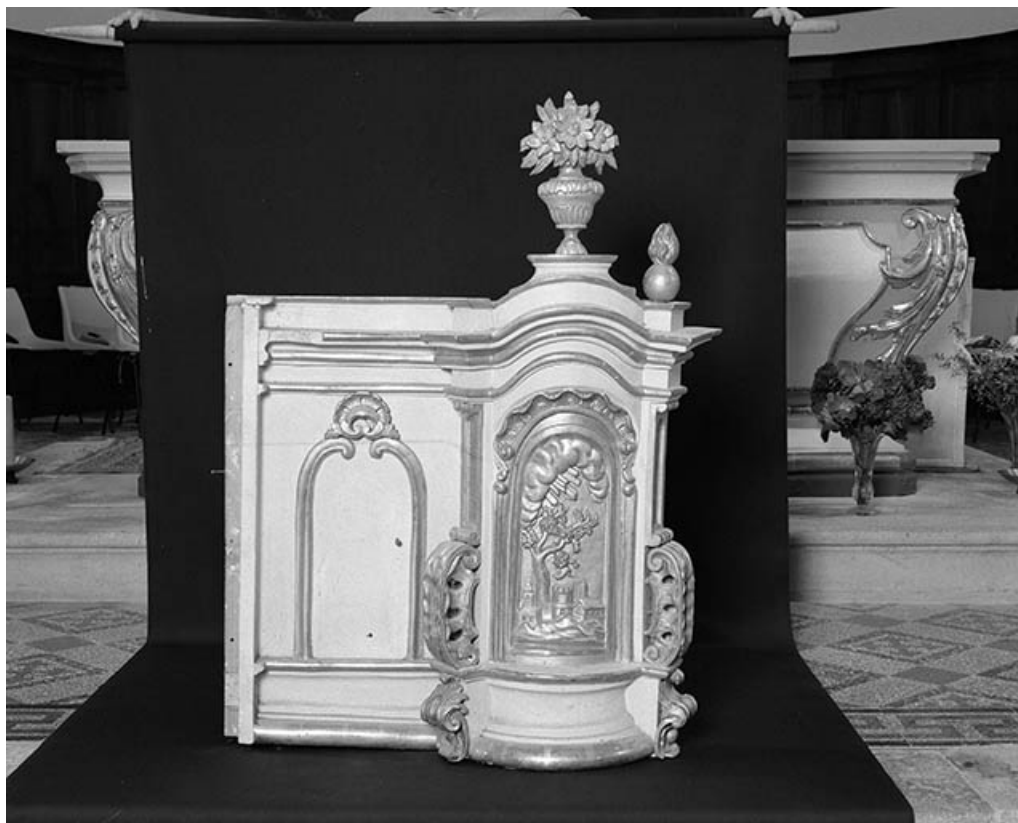
Maître-autel : tabernacle aile gauche. 25, Villeneuve-d'Amont rue du Château