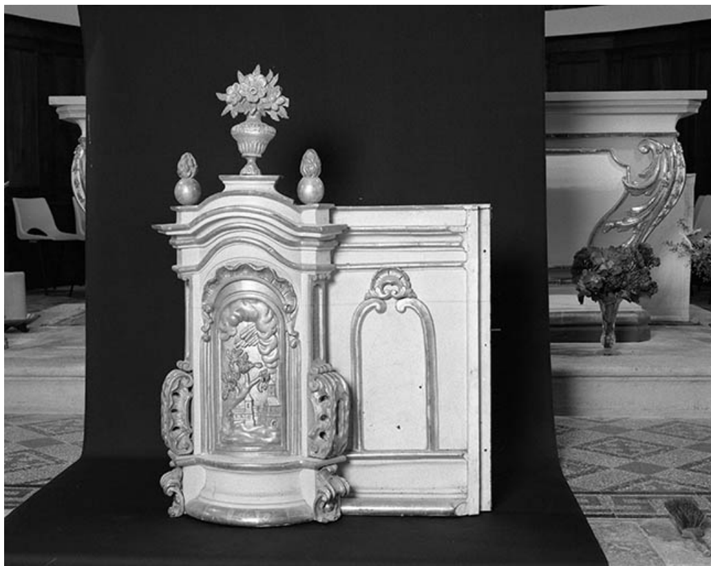
Maître-autel : tabernacle aile droite. 25, Villeneuve-d'Amont rue du Château