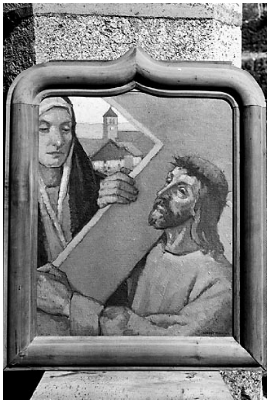
Vue de la 4e station.