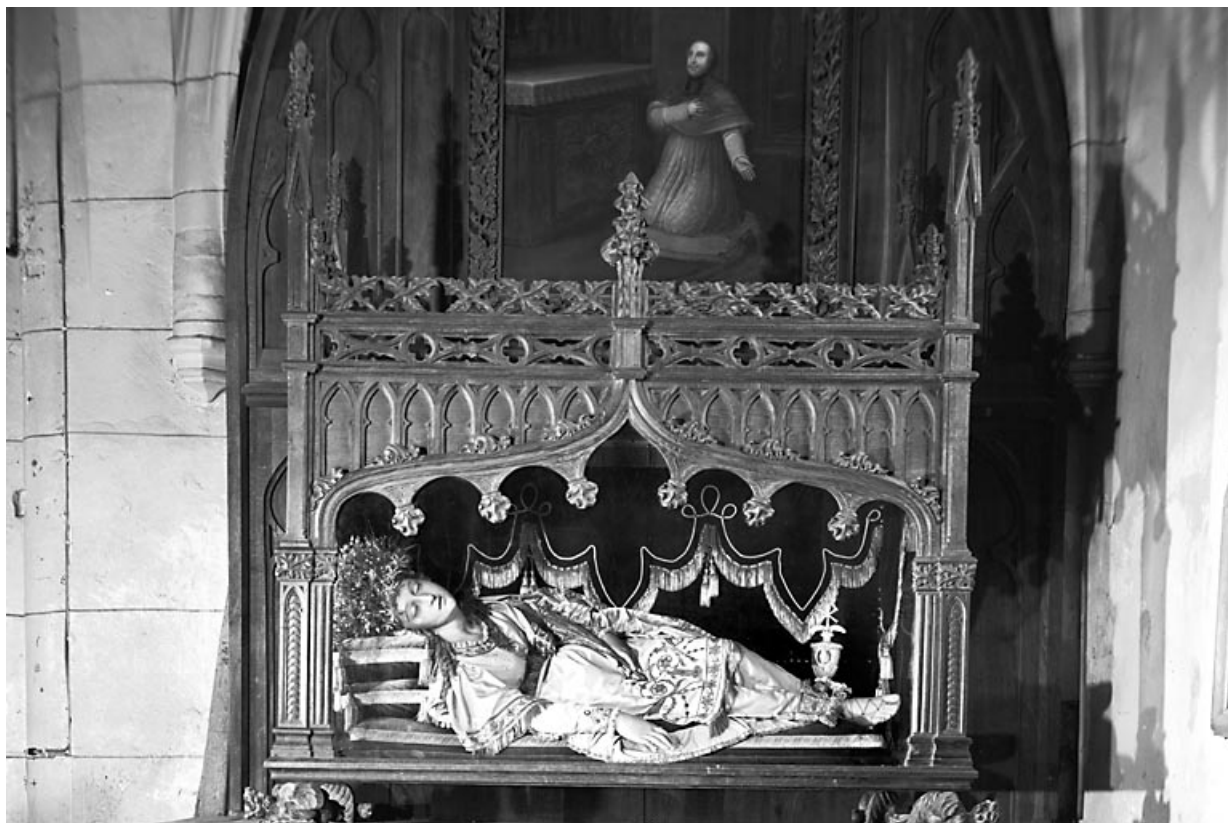
Vue d'ensemble. 25, Septfontaines