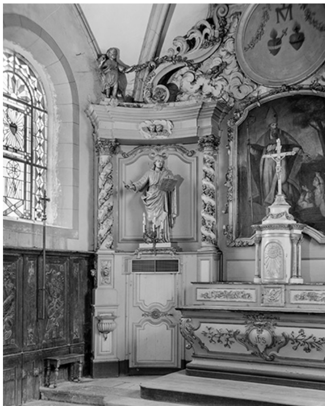
Saint situé à gauche : vue d'ensemble avec le maître-autel. 25, Septfontaines