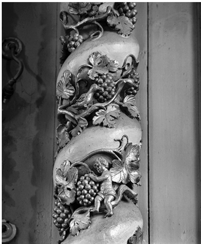
Détail d'une colonne du retable.