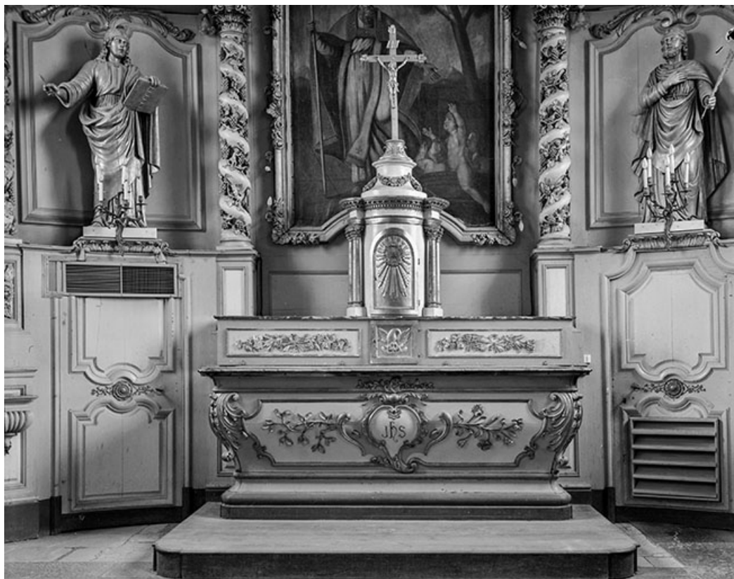
Autel et tabernacle.