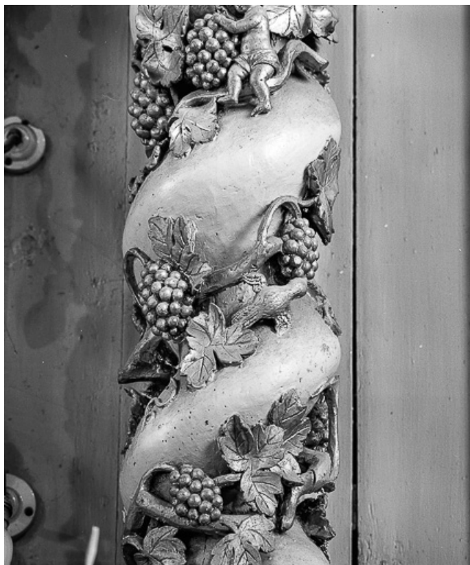
Détail d'une colonne du retable.