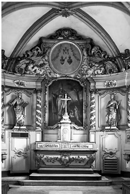
Vue d'ensemble. 25, Septfontaines