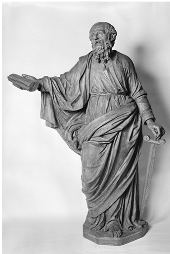
Saint Paul : vue de face.