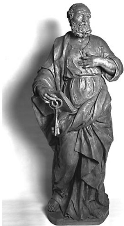
Saint Pierre : vue de face.