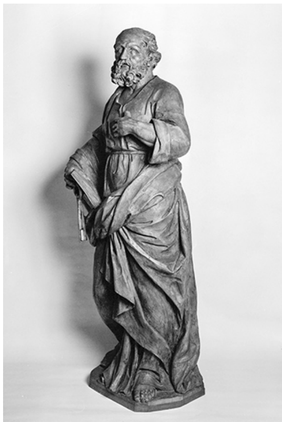
Saint Pierre : vue de trois quarts gauche.