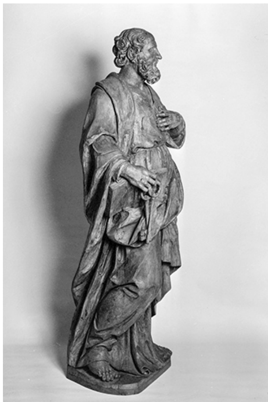
Saint Pierre : vue de trois quarts droit. 25, Levier place de l' Eglise