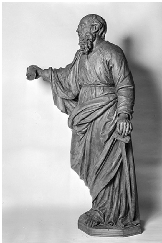
Saint Paul : vue de trois quarts gauche.