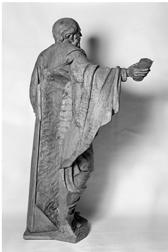
Saint Paul : vue de trois quarts arrière droit.