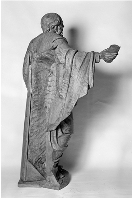
Saint Paul : vue de trois quarts arrière droit.