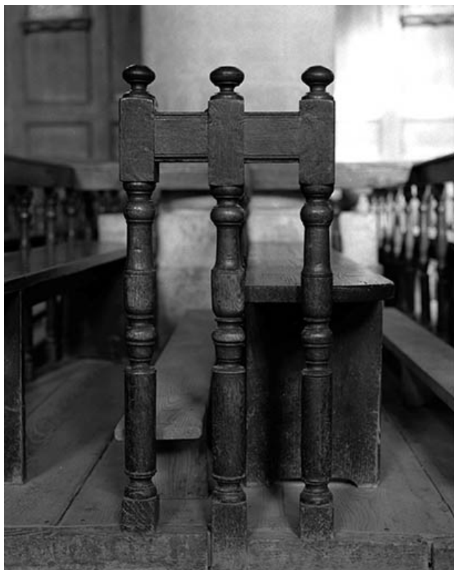
Détail d'un banc.