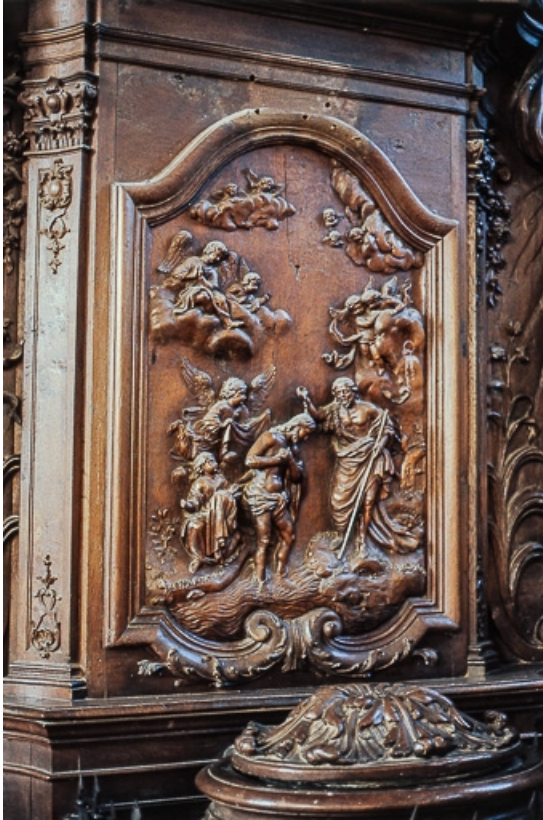
Détail : Baptême du Christ.