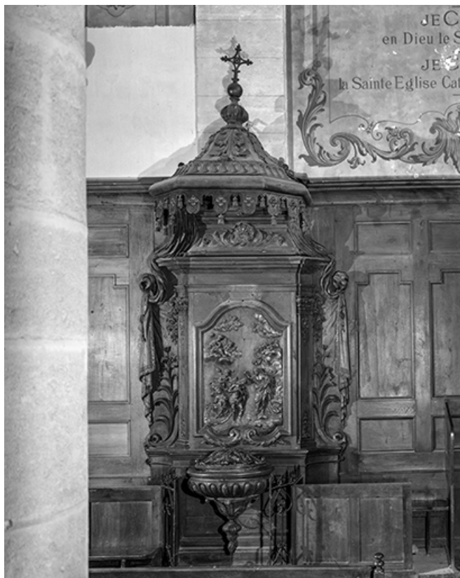
Vue d'ensemble. 25, Goux-les-Usiers