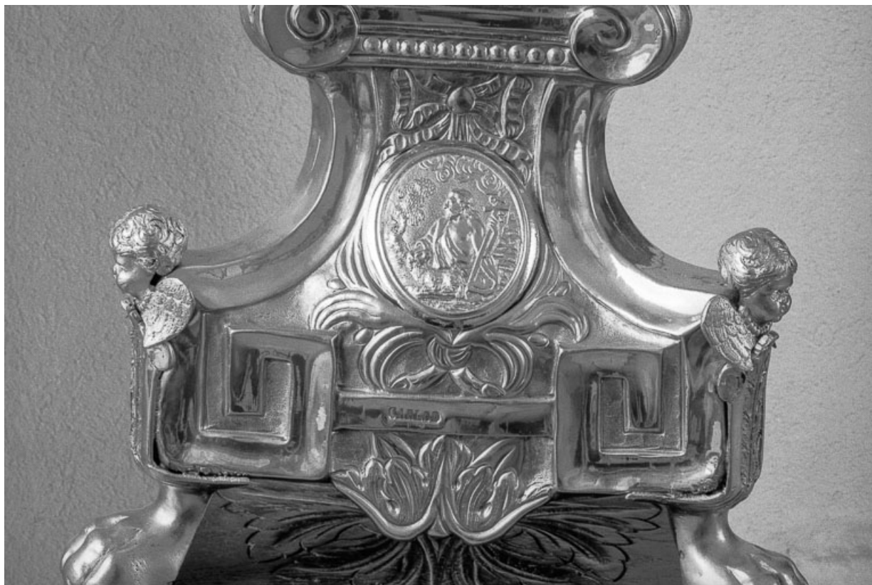
Détail du pied : le Bon Pasteur. 25, Évillers