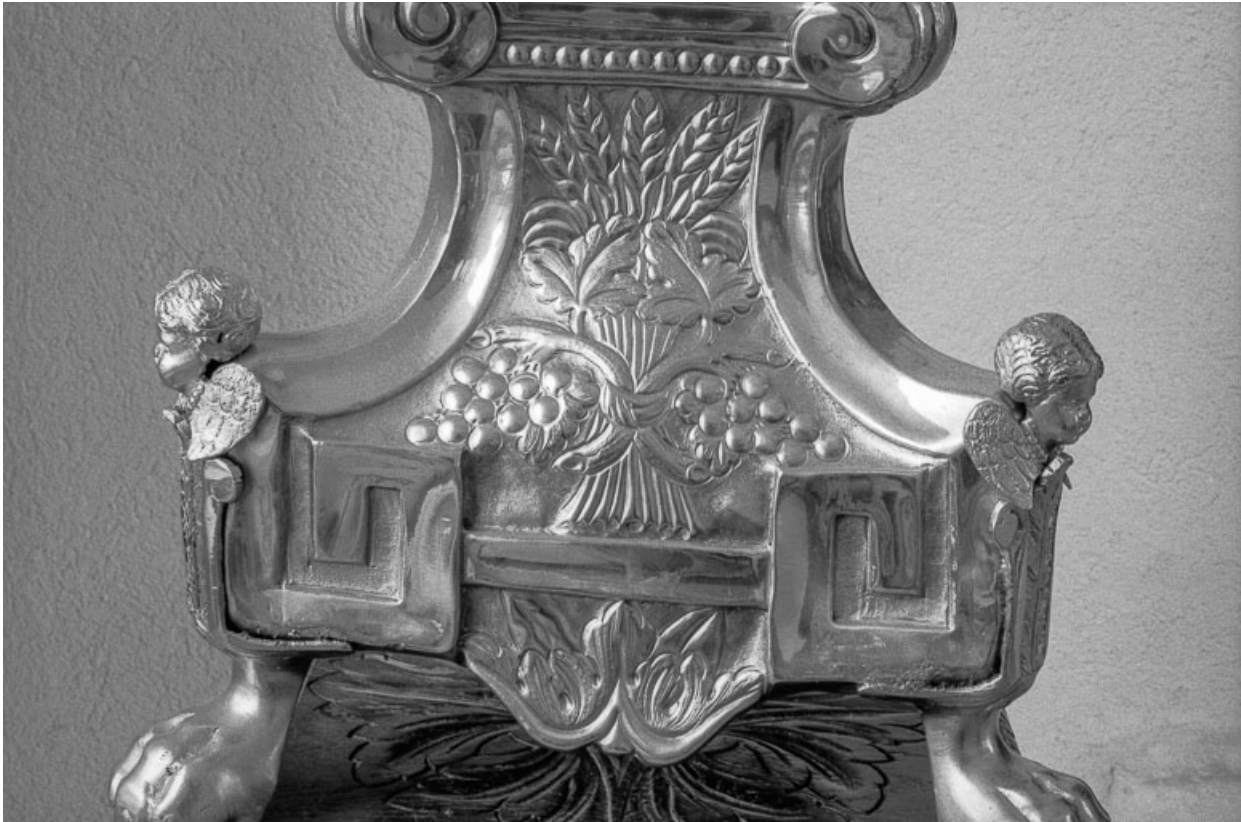
Détail du pied : gerbes de blé et pampres. 25, Évillers