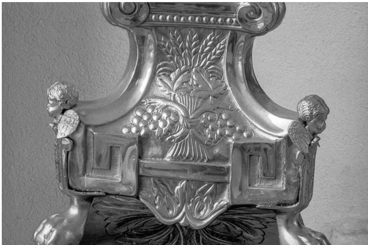
Détail du pied : gerbes de blé et pampres. 25, Évillers