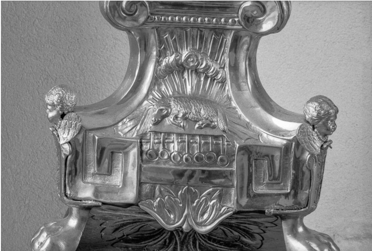
Détail du pied : l'agneau mystique. 25, Évillers