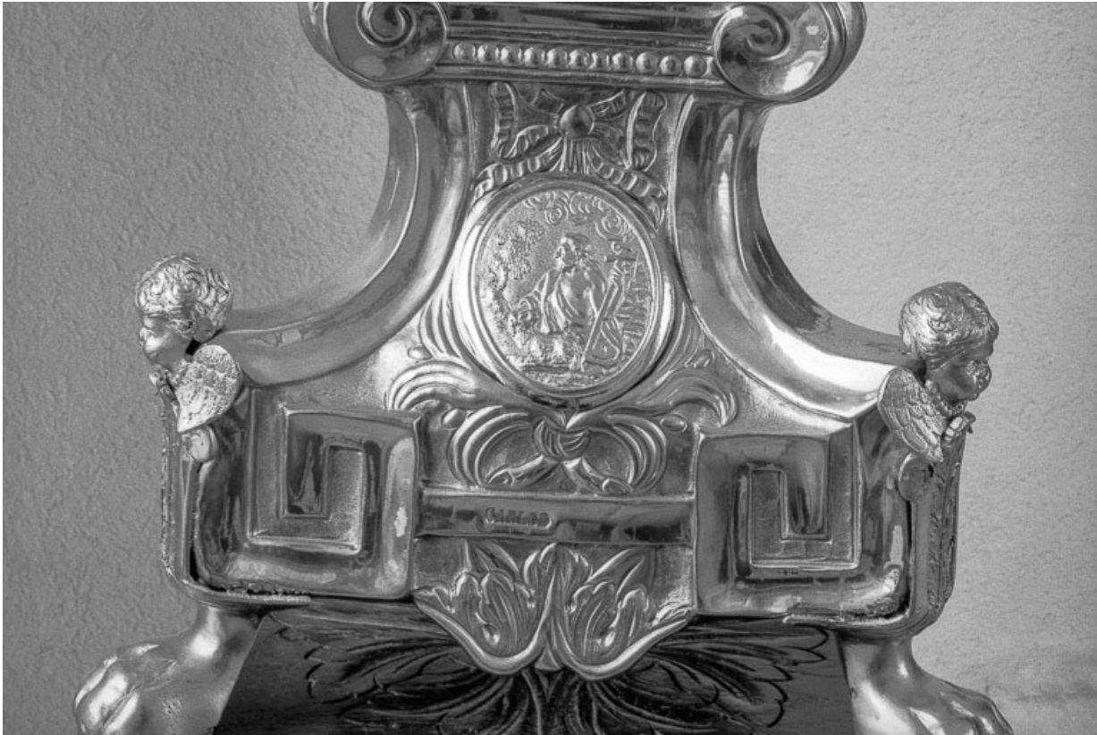
Détail du pied : le Bon Pasteur. 25, Évillers