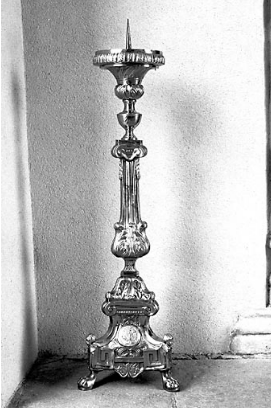
Vue d'un chandelier. 25, Évillers