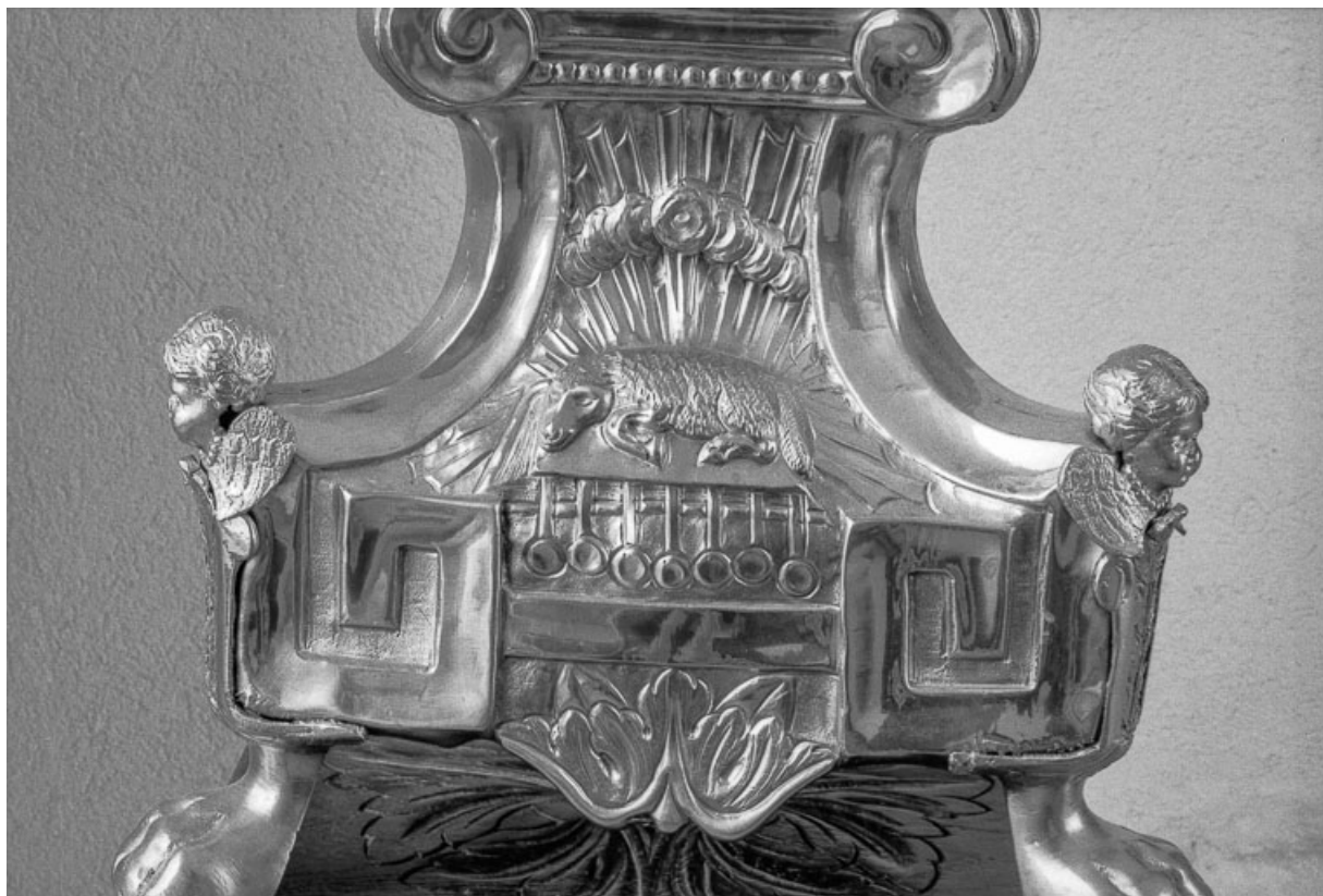
Détail du pied : l'agneau mystique. 25, Évillers