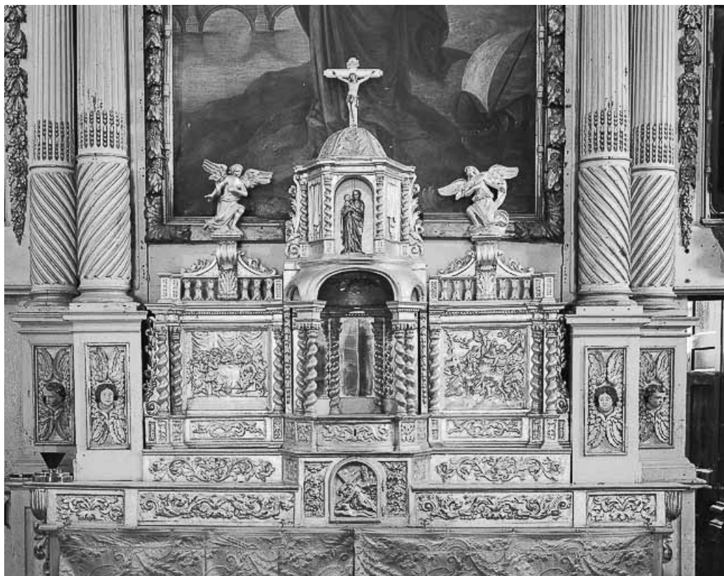
Maître-autel et son retable : tabernacle ouvert.