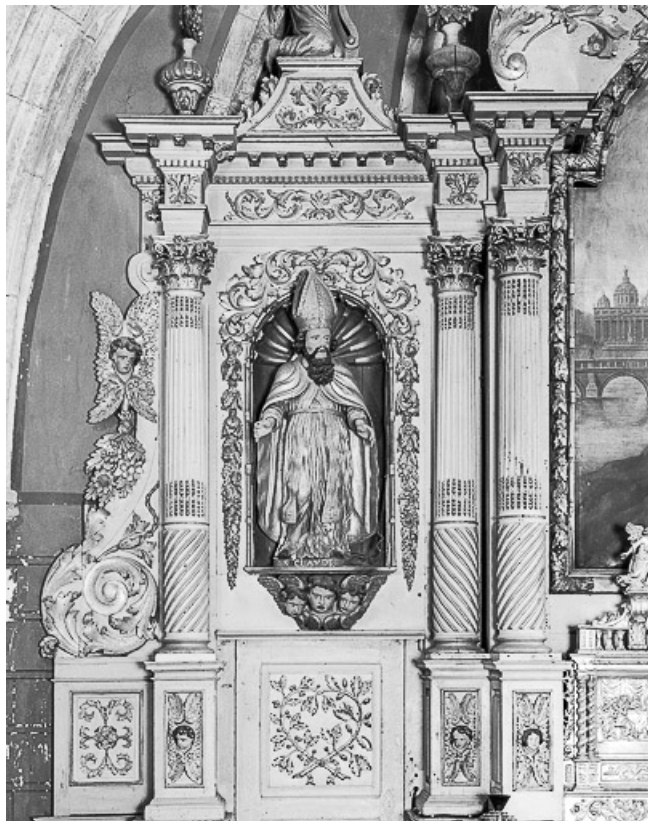
Détail : aile gauche du retable.