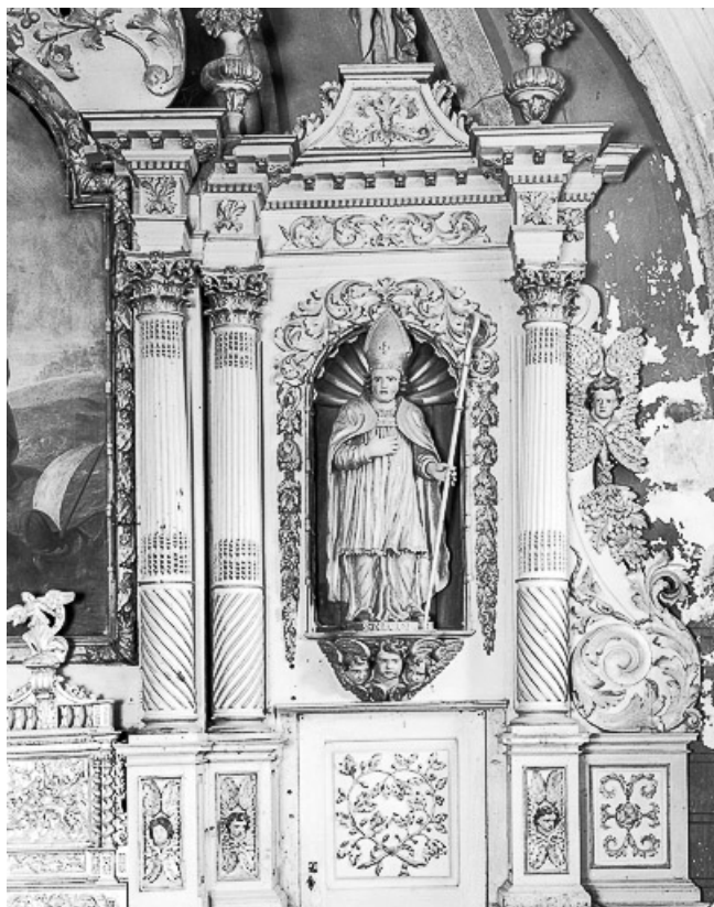
Détail : aile droite du retable.