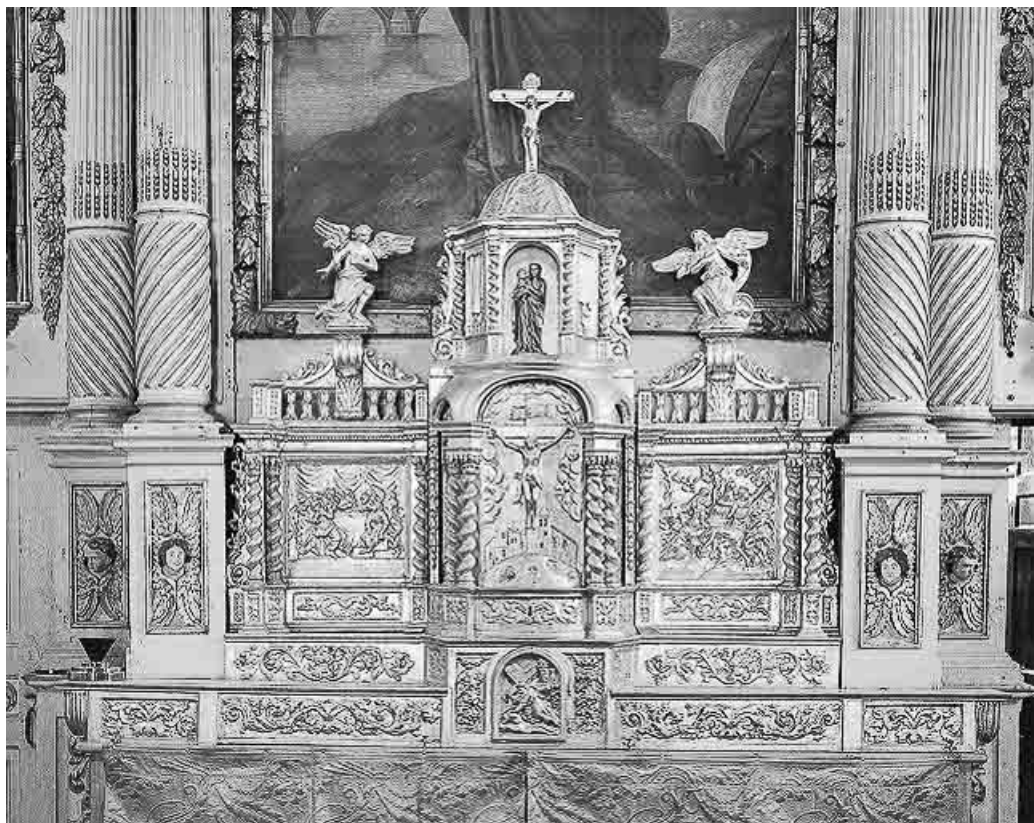
Maître-autel et son retable : tabernacle fermé.