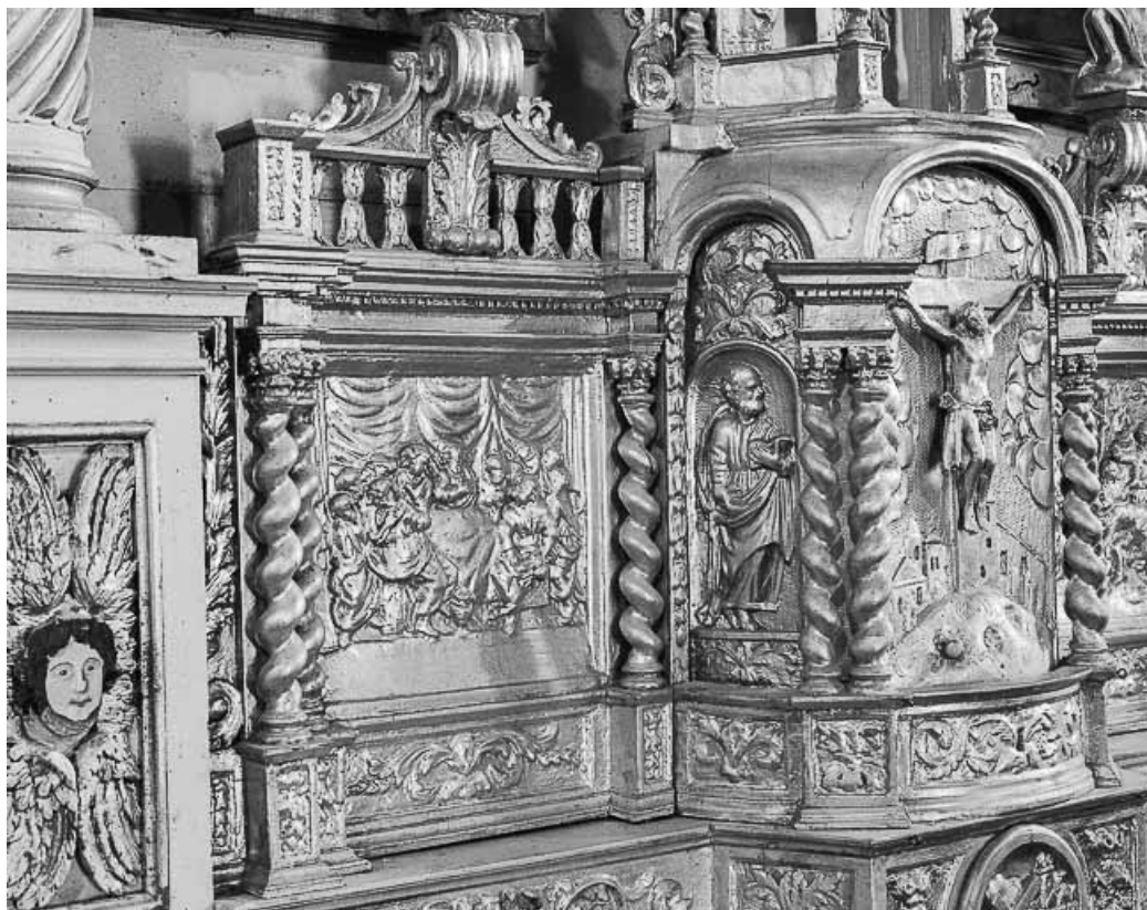
Détail du tabernacle : aile gauche. 25, Dompierre-les-Tilleuls