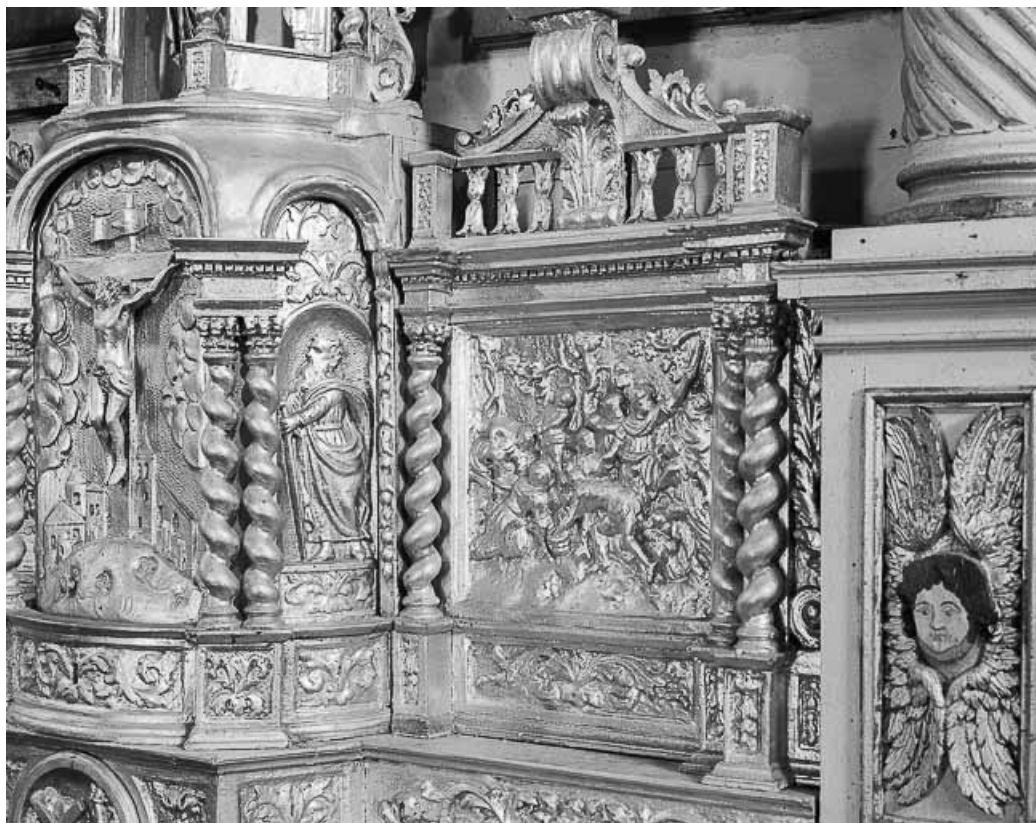
Détail du tabernacle : aile droite.