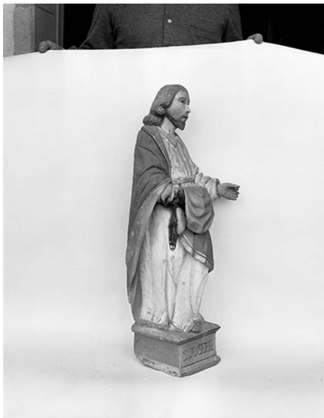
Saint Joseph trois quarts droit.