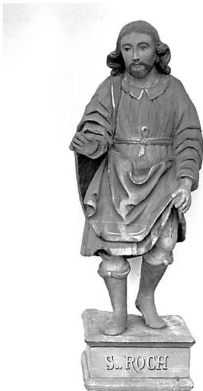
Saint Roch vu de face.