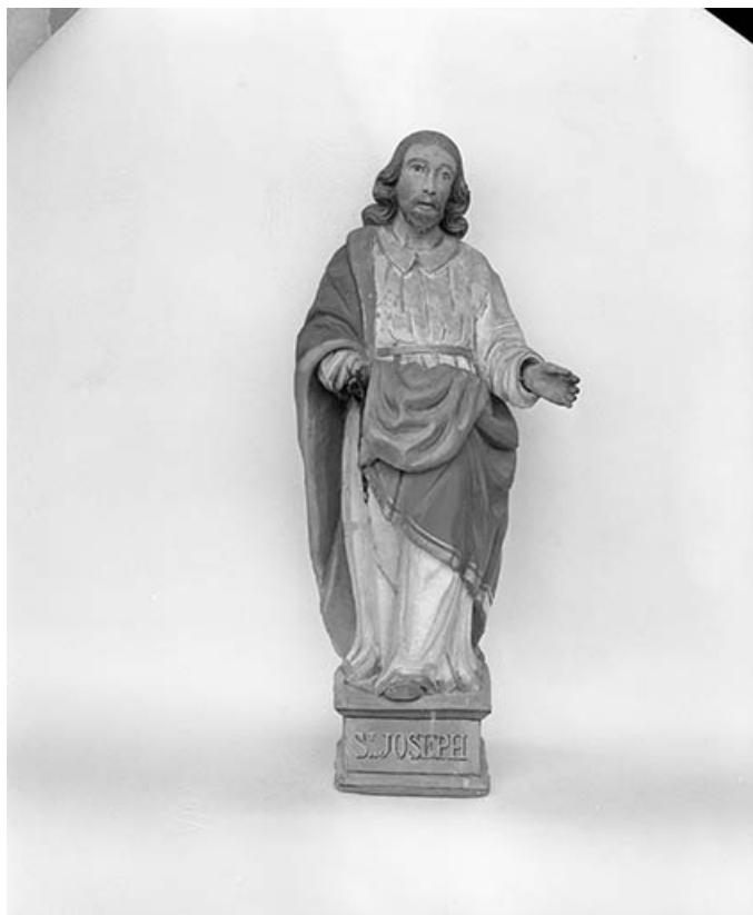
Saint Joseph vu de face.