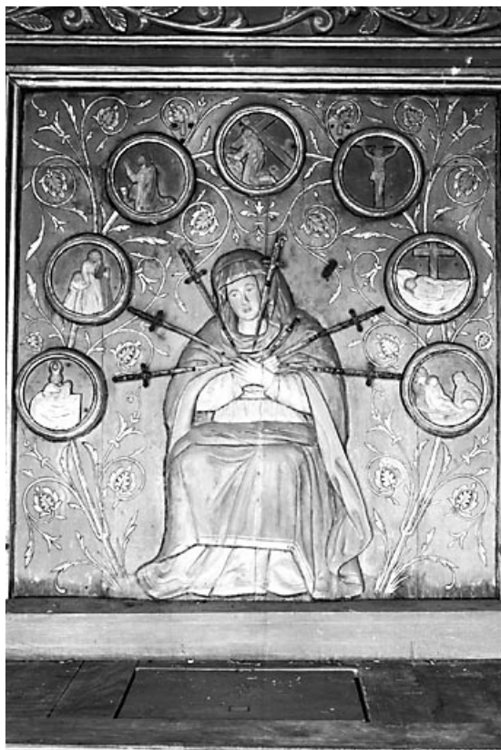
Vue générale. 25, Courvières