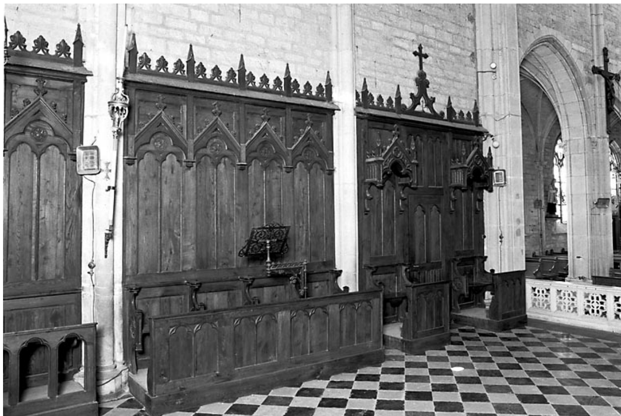
Vue d'ensemble des stalles et des lambris du mur sud du choeur. 25, Courvières