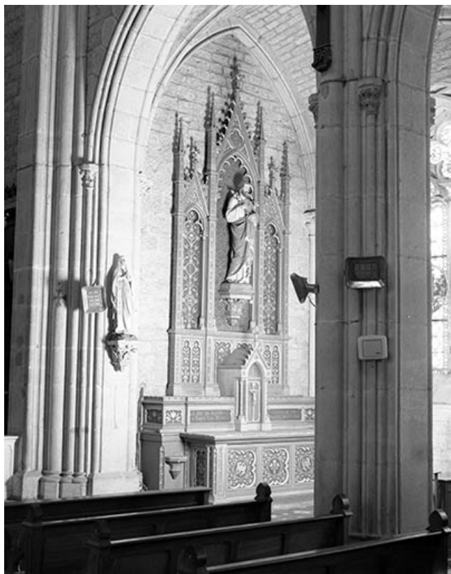
Vue d'ensemble de l'autel-retable latéral droit. 25, Courvières