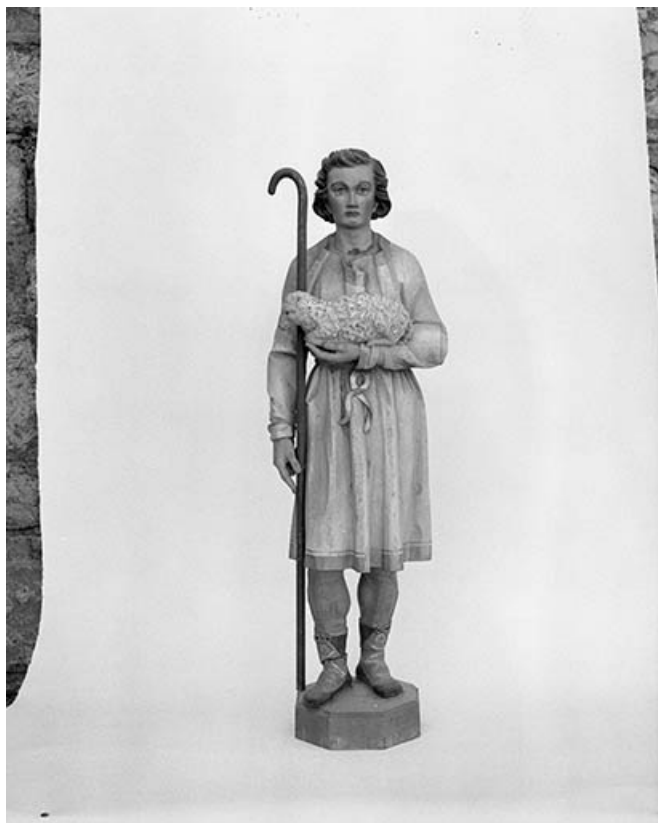
Statue : Abel 25, Courvières