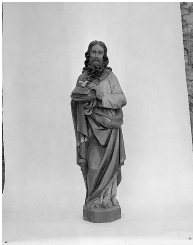
Statue : Noé 25, Courvières