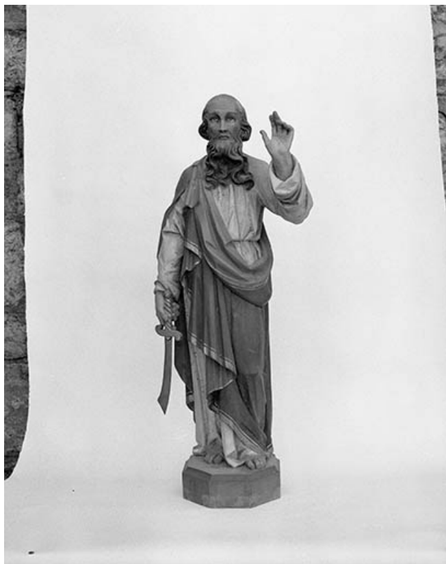
Statue : Abraham 25, Courvières