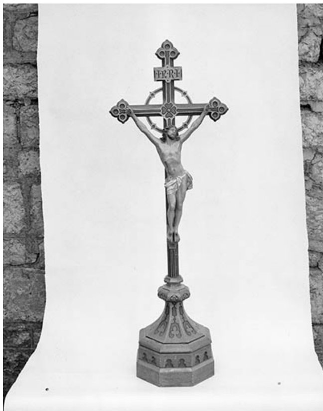
Croix d'autel 25, Courvières