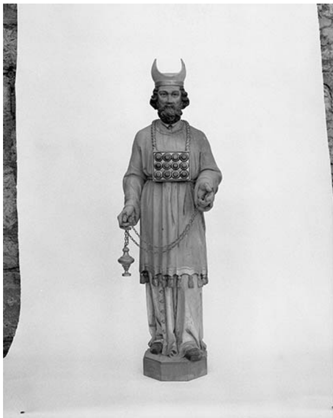
Statue : ?