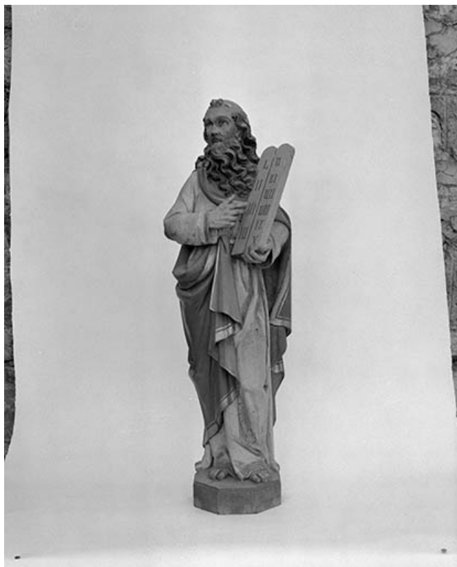
Statue : Moïse 25, Courvières