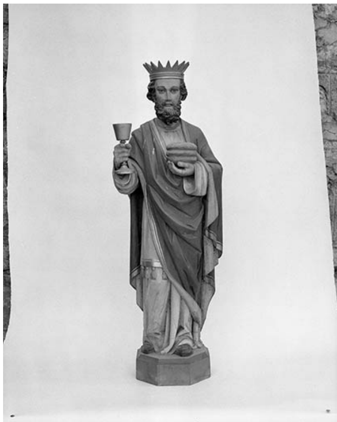
Statue : Melchisédech 25, Courvières