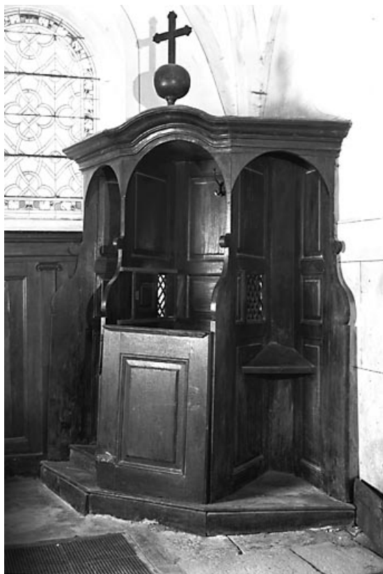
Vue d'un confessionnal.