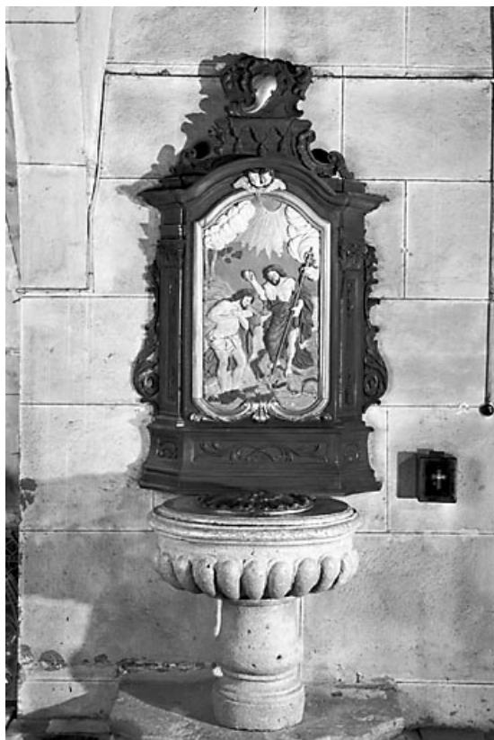
Vue d'ensemble. 25, Chapelle-d'Huin