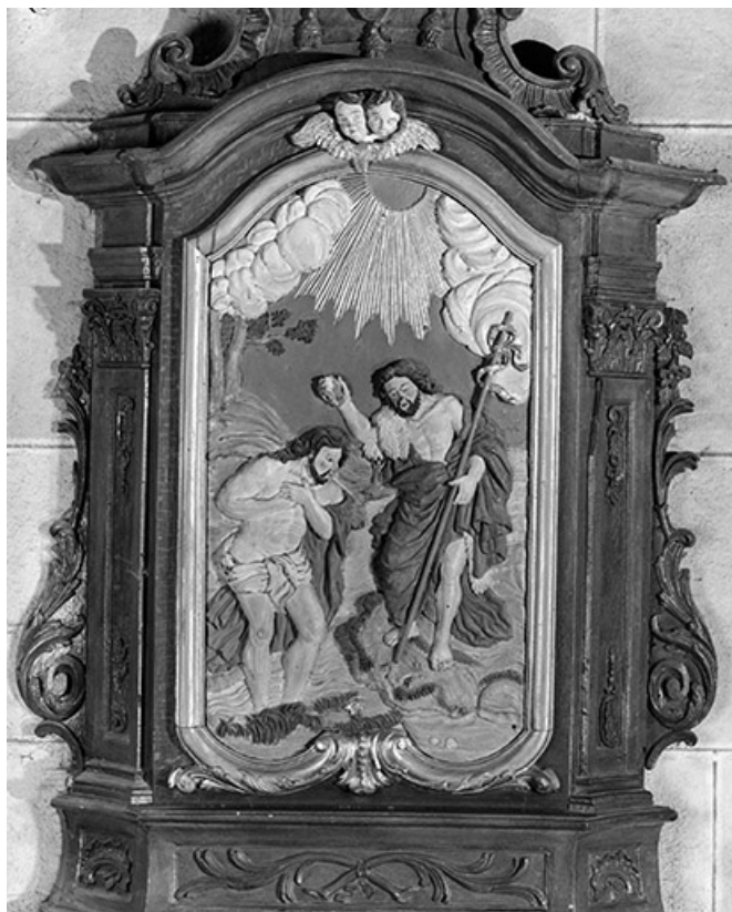
Retable : le Baptême du Christ.