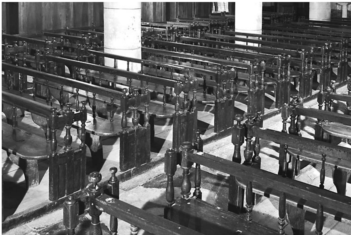
Vue d'ensemble. 25, Chapelle-d'Huin