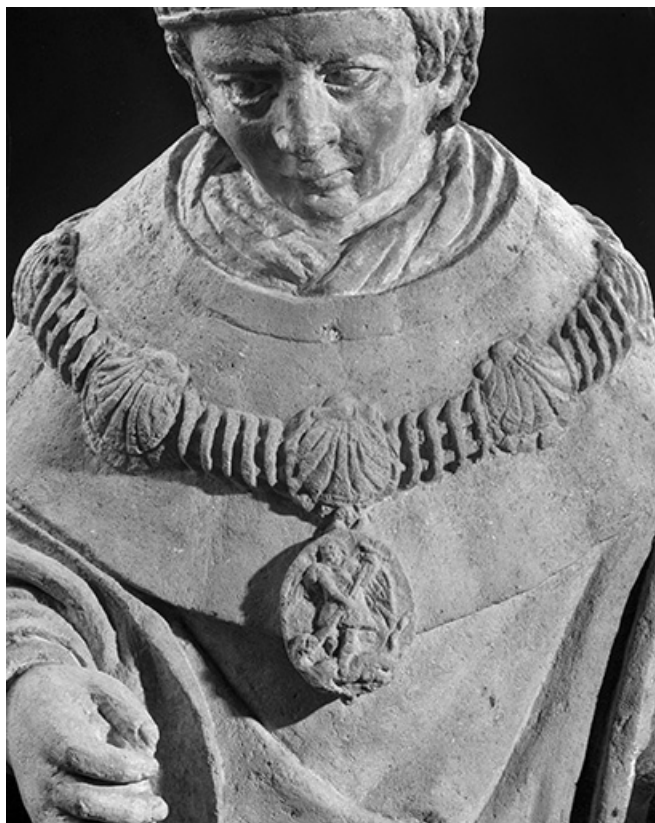
Détail : médaille.

25, Arc-sous-Montenot place de l' Eglise