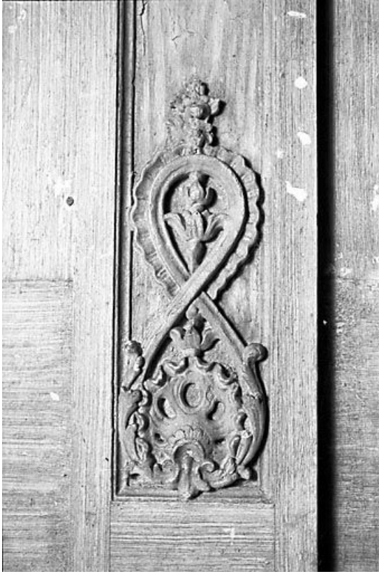
Détail d'une agrafe.