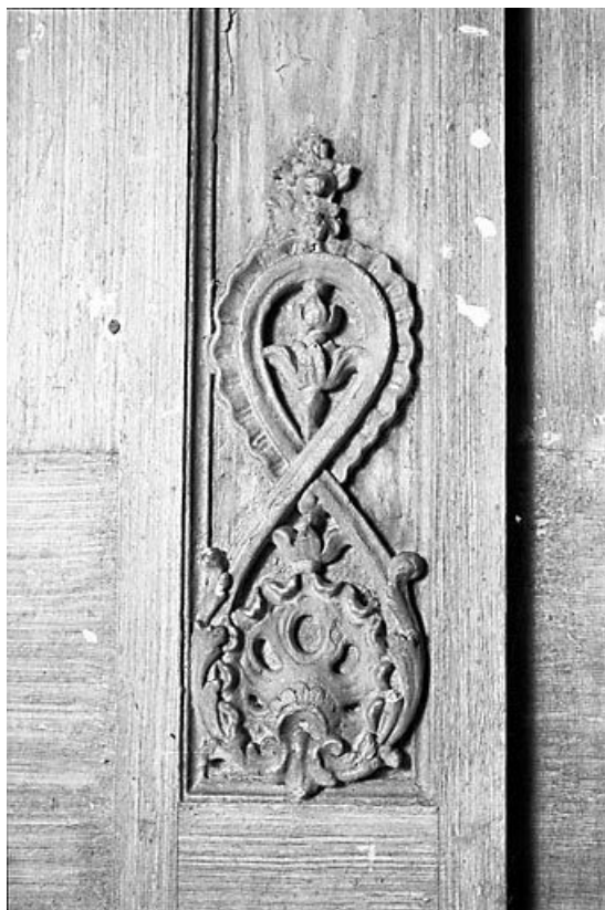
Détail d'une agrafe. 25, Montbenoît