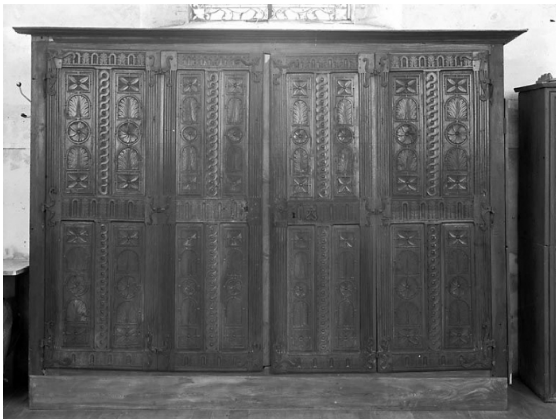
Vue générale. 25, Montbenoît