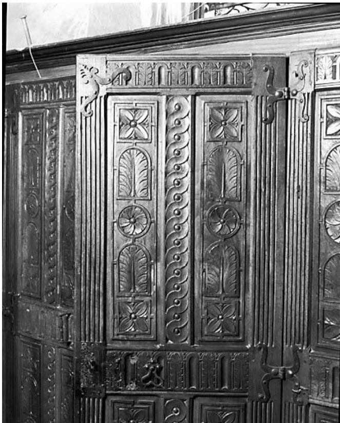
Battant droit. 25, Montbenoît