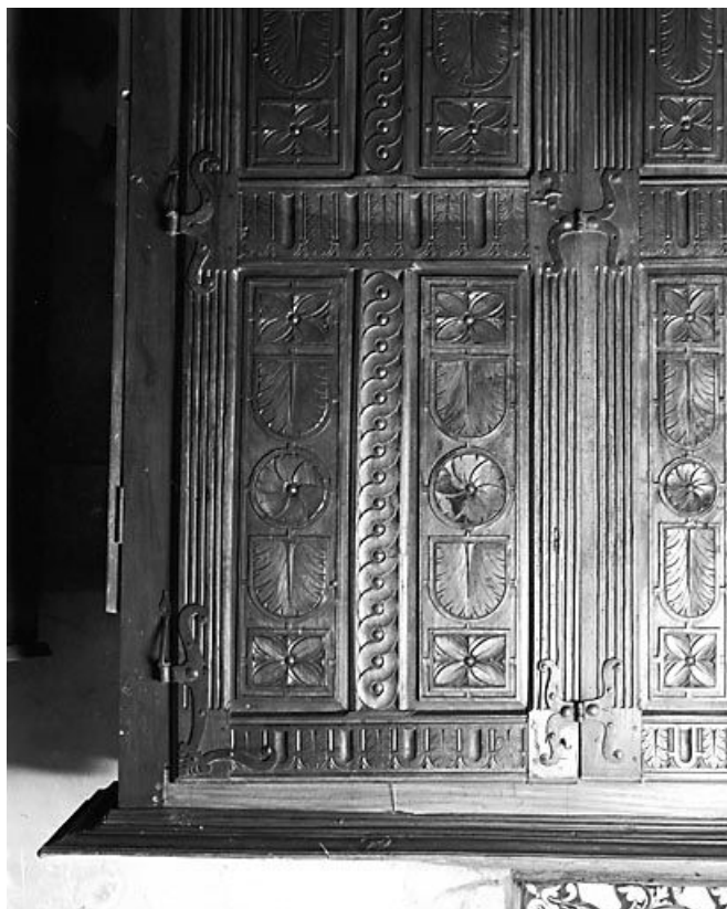
Battant gauche. 25, Montbenoit