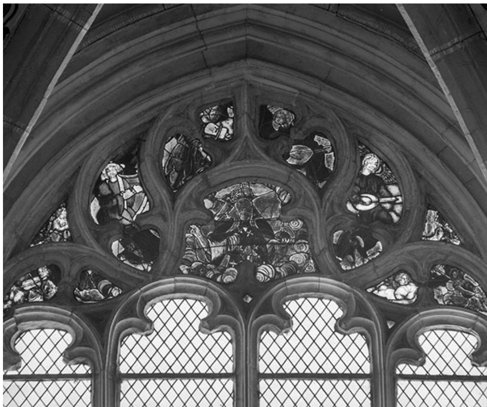
Baie 0, détail du tympan : Dieu le Père, quatre grands anges musiciens et six petits anges. 25, Montbenoît