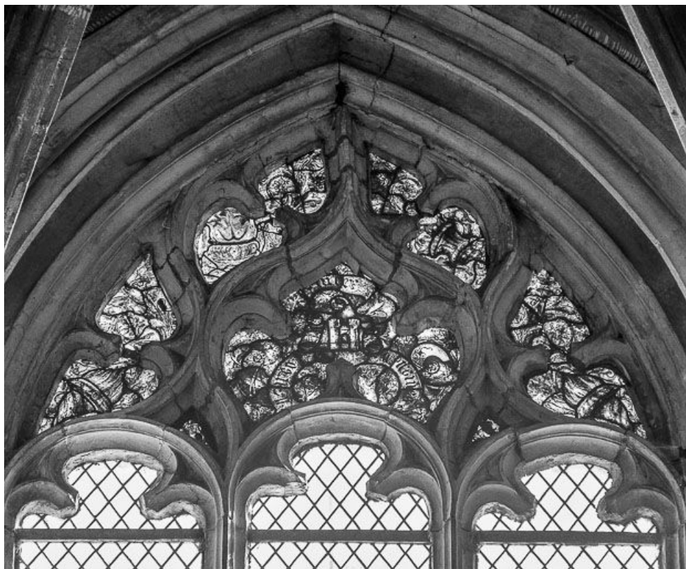
Tympan d'une des baies latérale. 25, Montbenoît