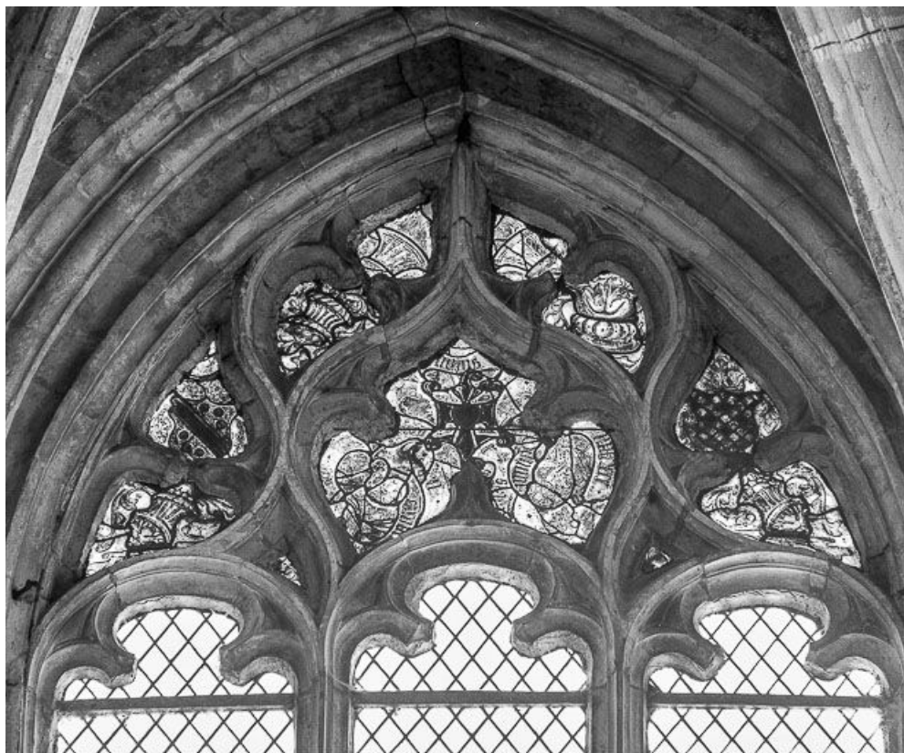
Tympan d'une des baies latérale. 25, Montbenoît