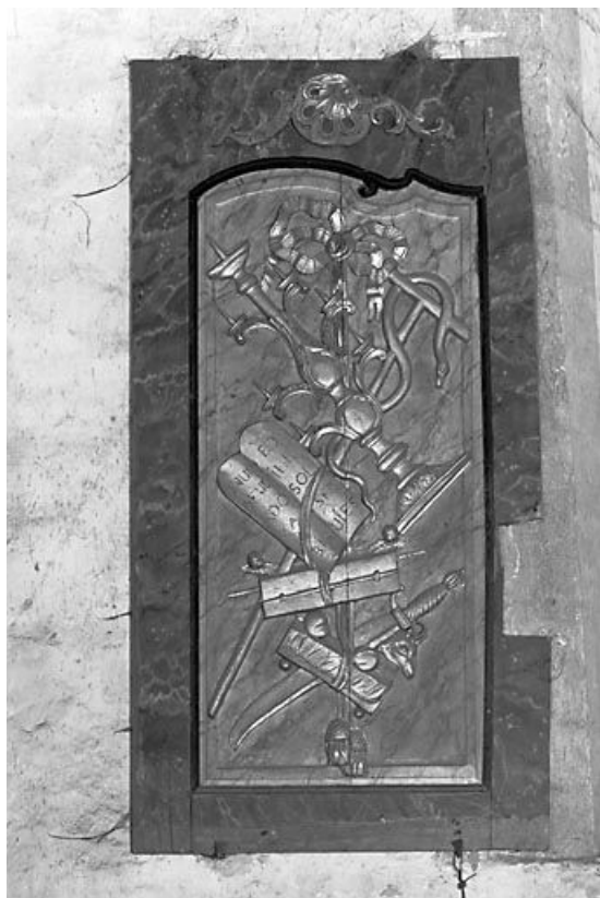
Le panneau avec les Tables de la loi. 25, Montbenoît