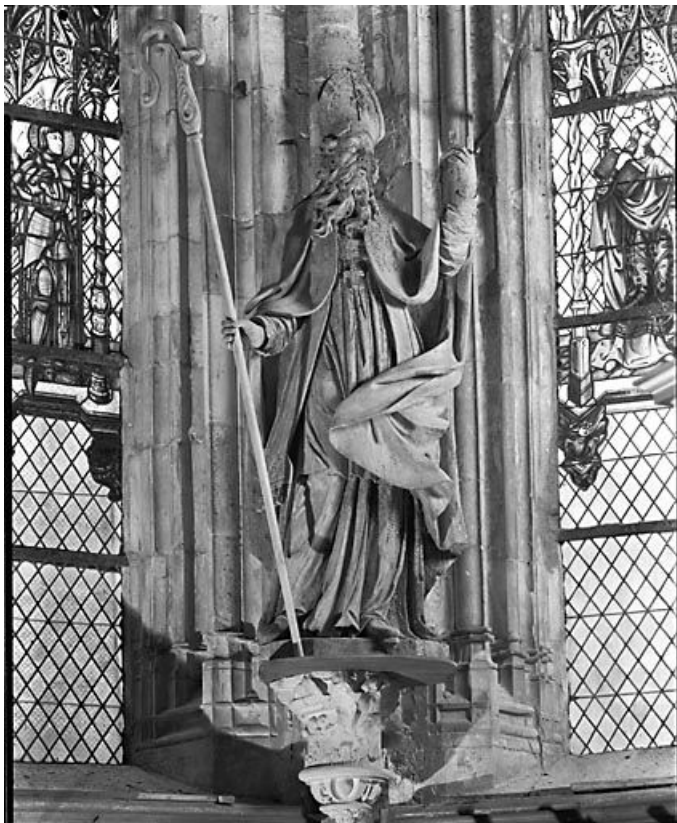
L'évêque vu de face.