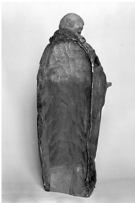
Vue du revers. 25, Montbenoît