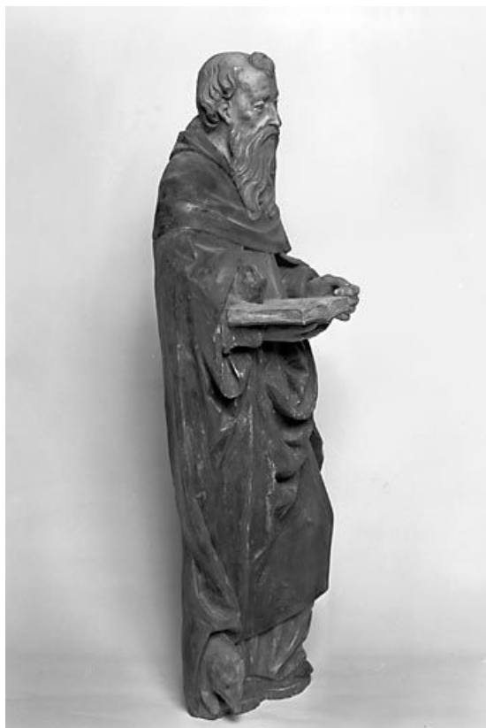
Vue de trois quarts.