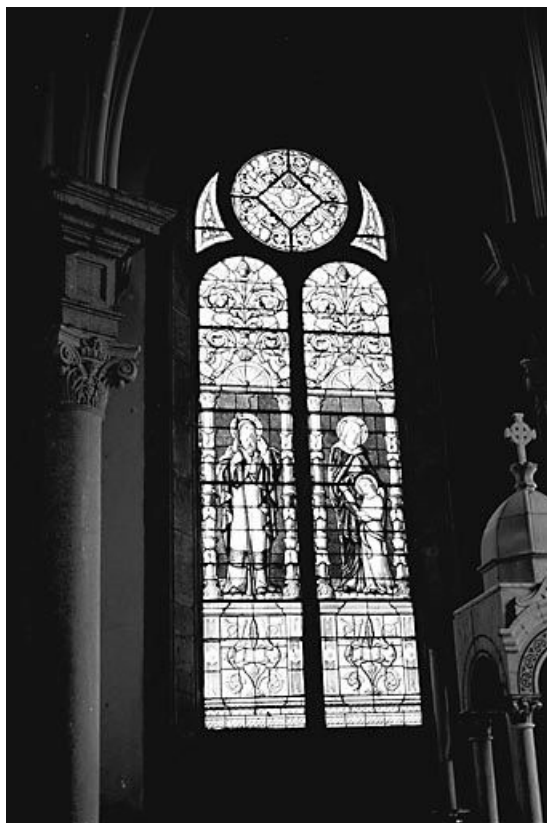
L'Education de la Vierge.