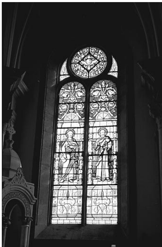
Saint Pierre et saint Paul. 25, Gilley