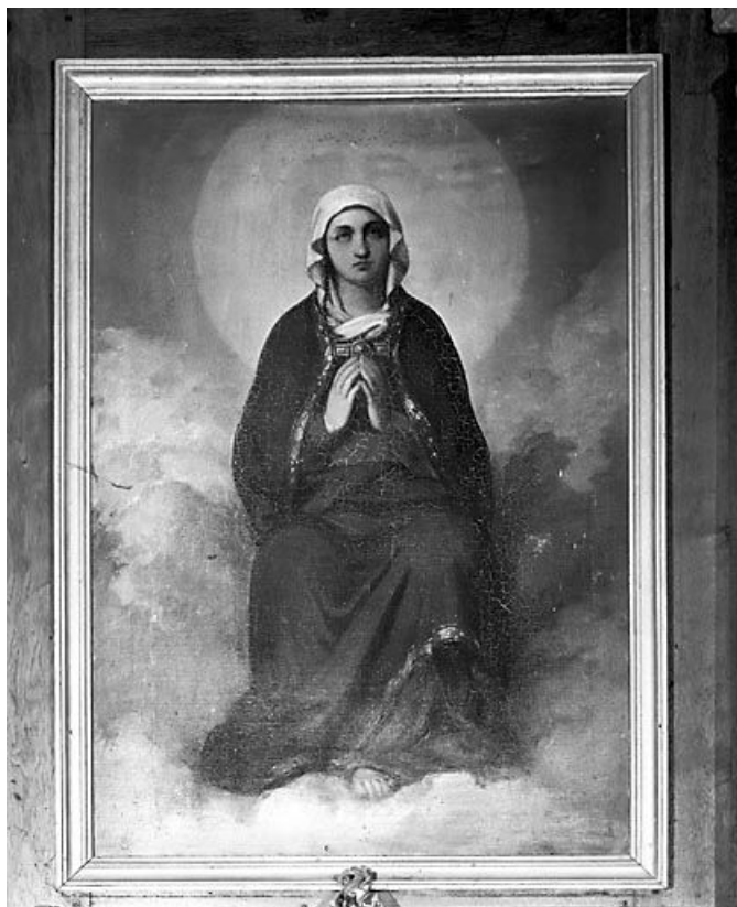
Sainte (?) . 25, Saint-Gorgon-Main