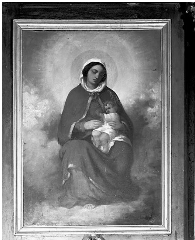
La Vierge à l'Enfant. 25, Saint-Gorgon-Main