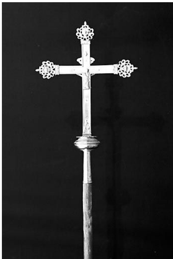
Vue de la face avec la Vierge à l'Enfant. 25, Bugny